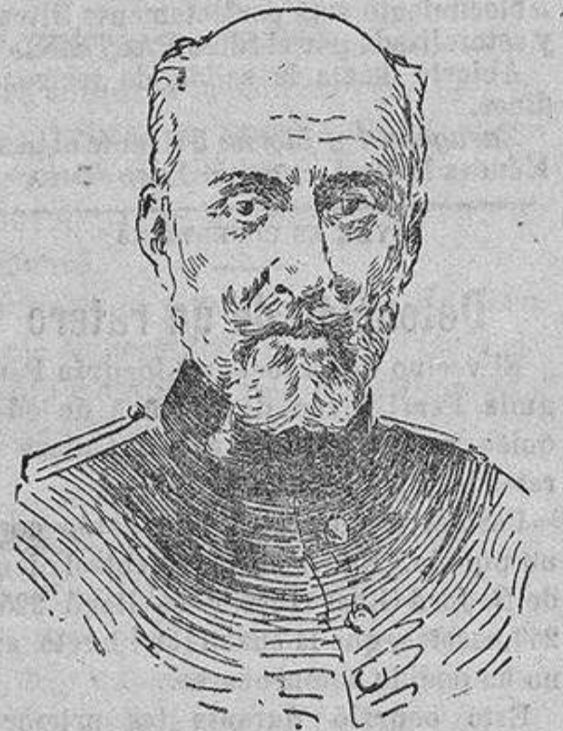
El general Ramón G. Mespacho Nuevo comandante general de Ceuta