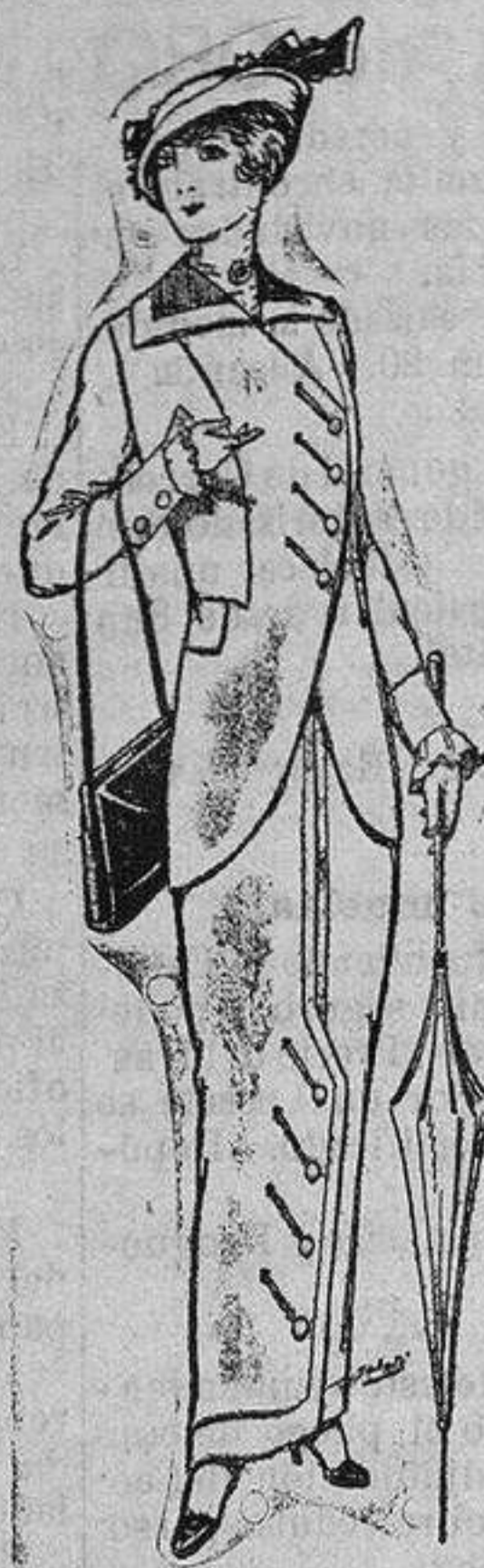
Traje jerga para Señora á Ptas. 65 y 75

Trajes alpaca, lana, etc., para Caballero . . . . . de 25 á 80 ptas. Trajes de dril, etc., para Caballero . . . . . de 10 á 35 > Impermeables é impermeabilizados . . . . . de 34 á 100 > Trajes de lana, etc., para Niño . . . . . de 5 á 38 > Trajes de dril, para Niño . . . . . de 4 á 18 >