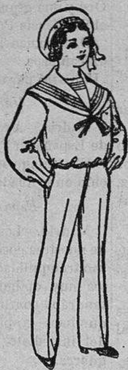
Trajes dril blanco para niño de 4 a 10 años de Ptas. 14 á 24

Repas confeccionados para Caballeros y Niño y Artículos de la Temporada