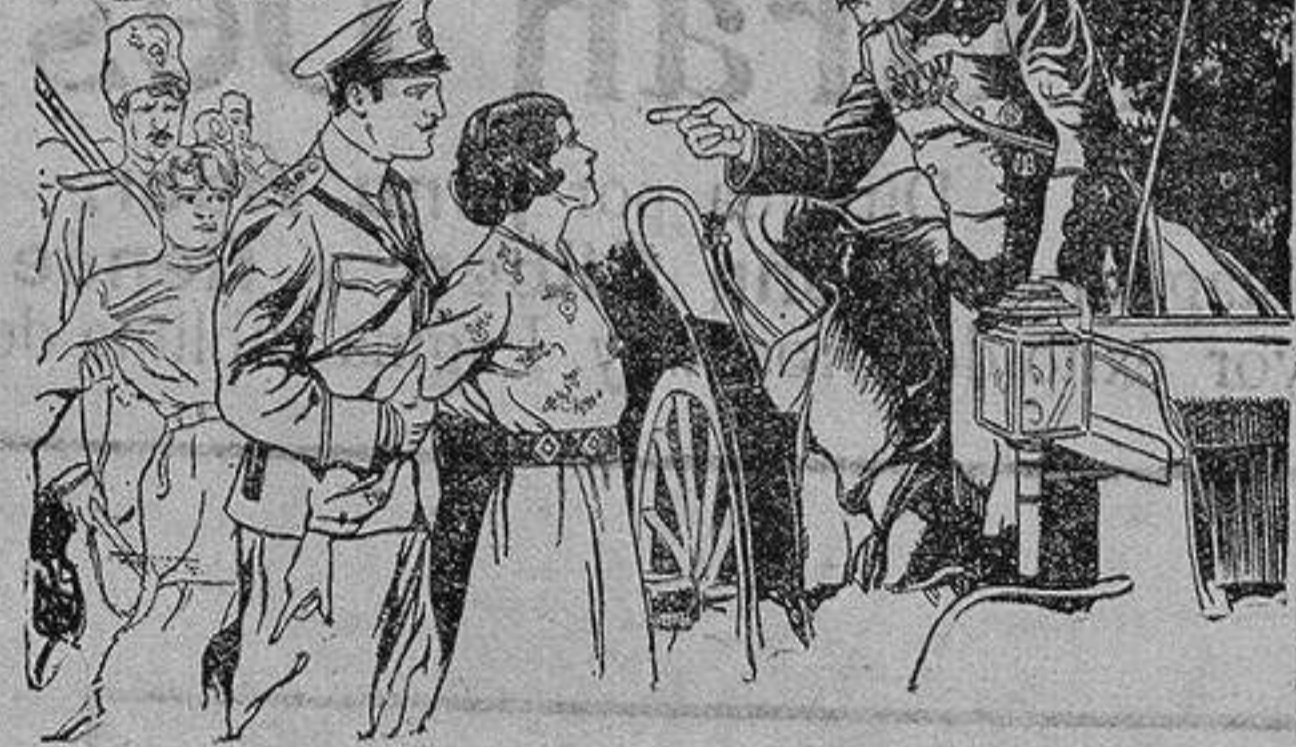
Intensísimo y bello cine drama de las deportaciones y cruentos castigos en tiempos del zar de Rusia.