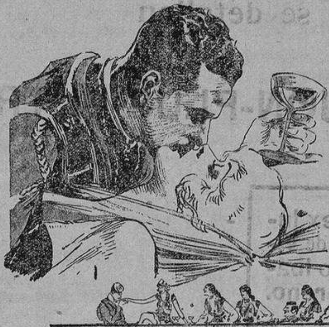
Una escena de la preciosa opereta LA VIUDA ALEGRE

Su labor en esta cinta es, en una palabra, incommensurable y no se concibe nada mejor, aun cuando