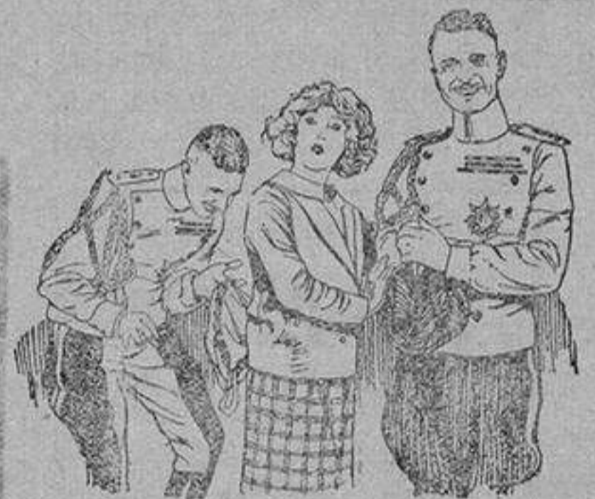
Otra escena de LA VIUDA ALEGRE

pasado un mal rato porque el papel de villano (Príncipe heredero, munmente se encarga de la dirección de estas producciones a gente que conoce tanto de los países y todo, dando constantemente la ilustros europeos como yo desición de ver a su famoso director la caza del oso blanco; pero esta vez la METRO-GOLDWYN ha tenido el acierto de encargar la dirección de la opereta del famoso von Stroheim. La primera parte de vals, a von Stroheim, director ca la película es completamente oripaz de entender de filmar «La Viuda Alegre», y el resultado ha sido es cuando verdaderamente empiezan un éxito artístico y un éxito financiero a usarse del argumento de la ciera: UN ÉXITO COMPLETO, opereta, pero está tan bien arreglado que, en vez de quitar mérito magistral; en otras palabras: es de la producción, le da vida y la en von Stroheim. La interpretación es riquísima. A todo esto añádesese la música de von Stroheim; este es la partitura entera aumentado con otros vales de Franz una viudita encantadora; jamás vi Lehar que ha encantado al mundo a la encantadora estrella mostrándose y se dará uno cuenta del sus eucantos con más gracia, y éxito sin igual de la película «La jamás la vi tan artista. Lo mismo Viuda Alegre», por el que debe fese puede decir del joven Gilbert licitarse a los productores, director en el papel de Príncipe Danilo, y e intérpretes que han hecho la merece también especial mención por producción de la temporada.»