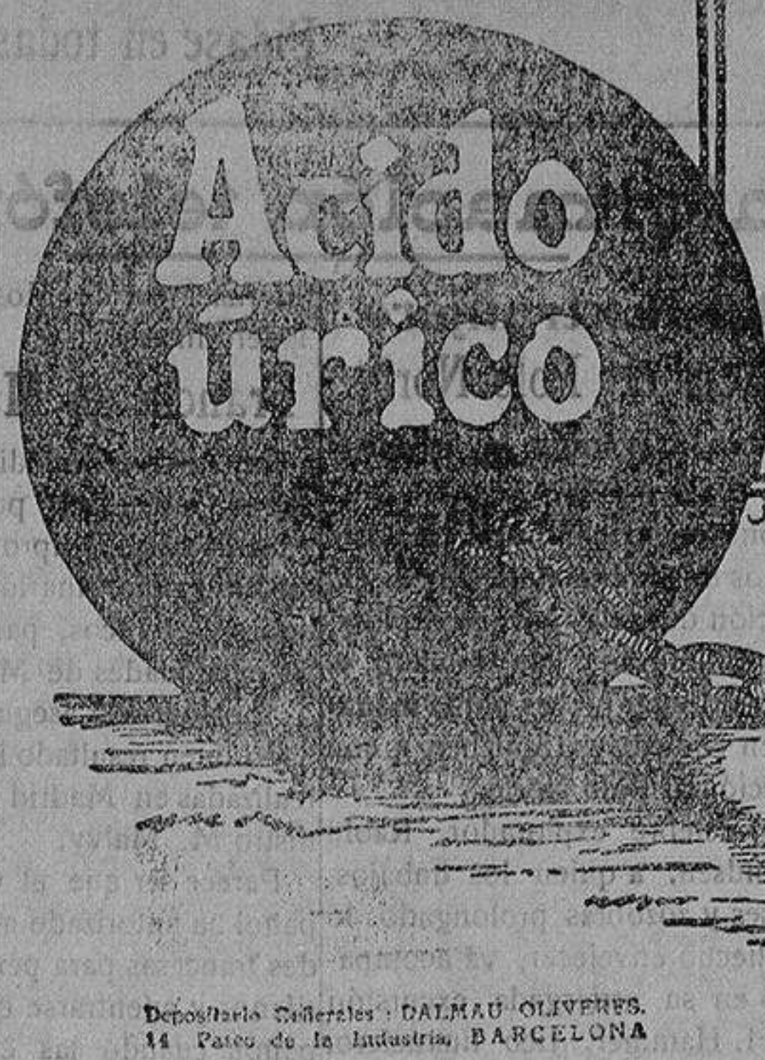
Depositaría Cofretería DALMAU OLIVERES. 14 Paseo de la Industria, BARCELONA

Maderas del país y extranjeras Maisannave, 29.-ALICANTE