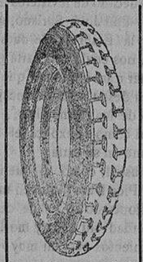
La cubierta recauchutada que le devuelve la fábrica.

que si usted adquiriera una cubierta nueva le dejaremos la que nos entregue rota para recorrer 20.000 kilómetros más.