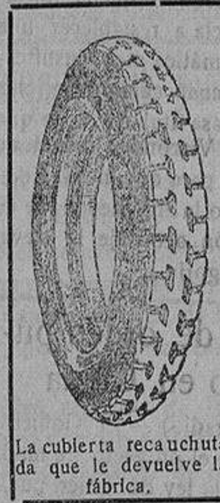
La cubierta recauchutada que le devuelve la fábrica.

que si usted adquiriera una cubierta nueva le dejaremos la que nos entregue rota para recorrer 20.000 kilómetros más.