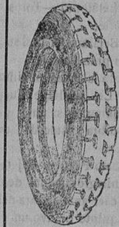
La cubierta recauchutada que le devuelve la fábrica.

que si usted adquiriera una cubierta nueva le dejaremos la que nos entregue rota para recorrer 20.000 kilómetros más.