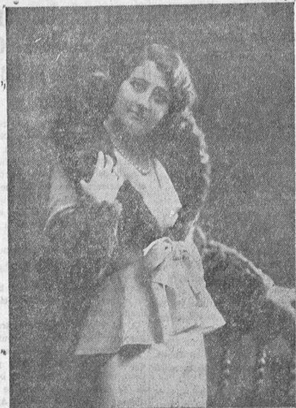
EMINENTE ACTRIZ QUE AL FRENTE DE SU COMPANIA SE PRESENTARA EL MIERCOLES EN EL TEATRO PRINCIPAL