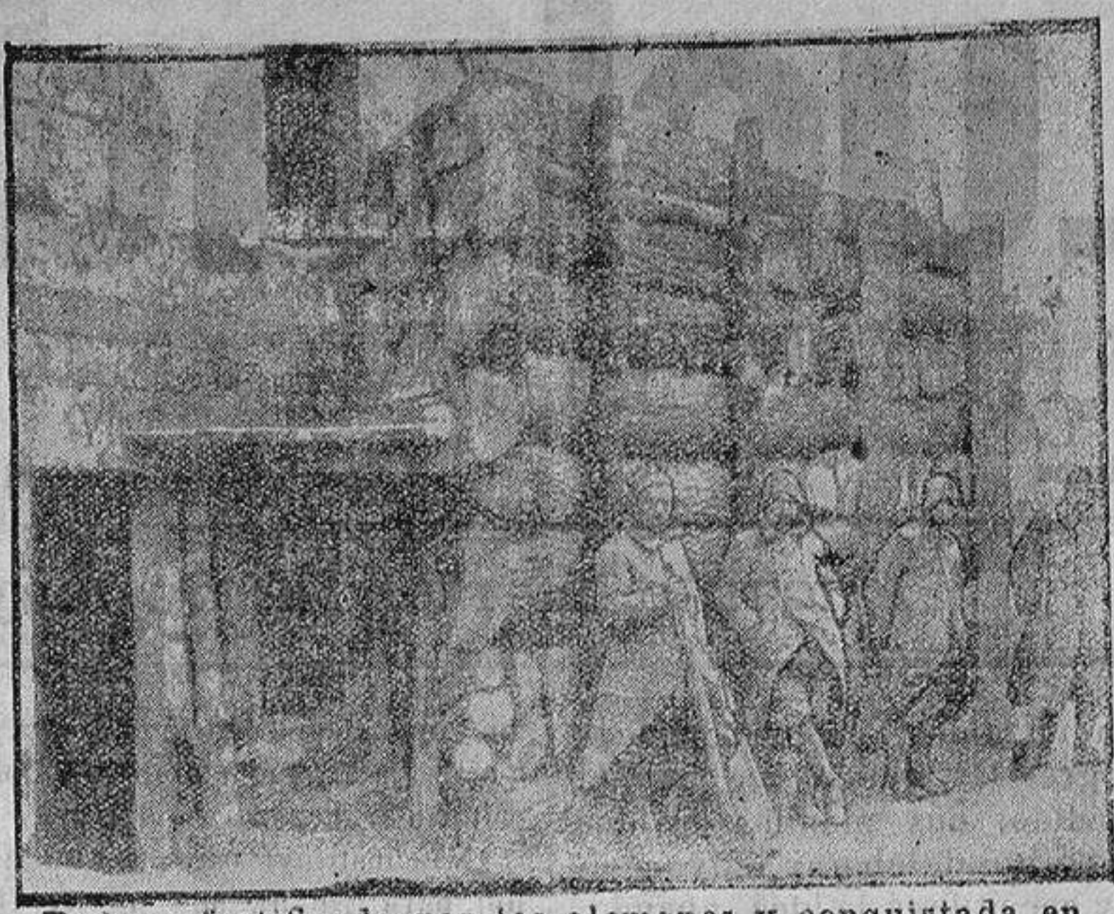
Bodega fortificada por los alemanes y conquistada en la plaza de Noyón

«En los círculos parlamentarios se cree que el Reichstag, convocado el 5 de Julio para nueva sesión, tendrán que ocuparse probablemente en un nuevo proyecto de empréstito militar.»