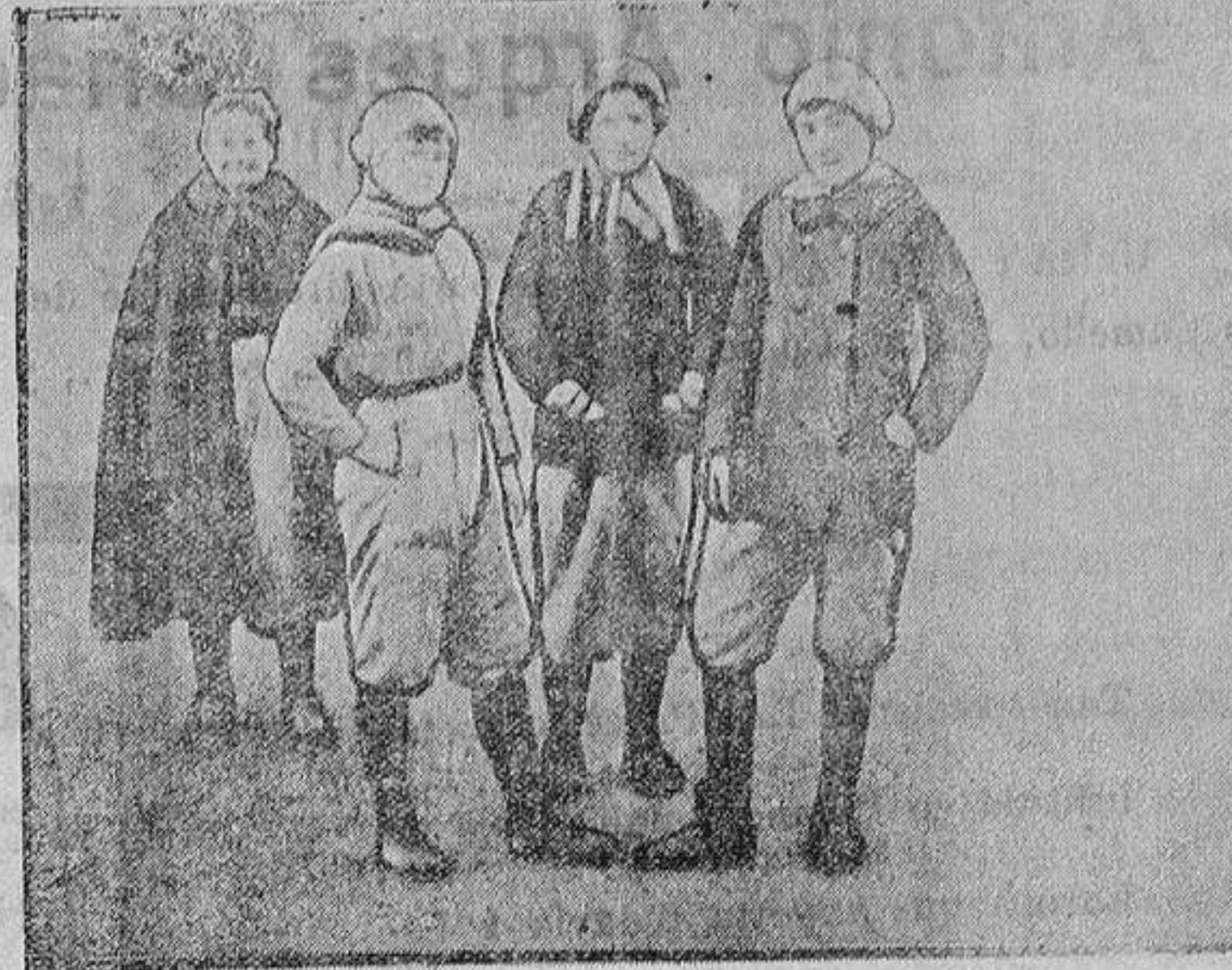
Obreros durante un descanso en las fábricas militares

De Madrid en donde cursan sus di- versos estudios con objeto de pasar los días de Carnaval, nuestros esti-