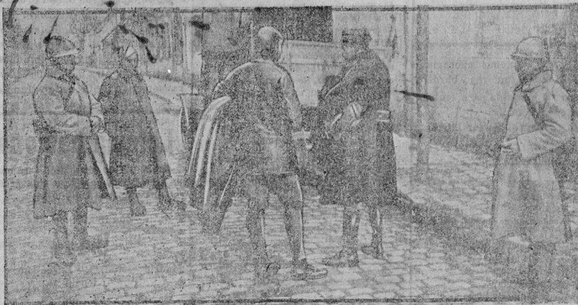
Aviadores alemanes prisioneros

Para acabar con esta larga serie de mixtificaciones, se constituye la Liga Antigermanófila. Huelga decir que es neutral, absolutamente neu-