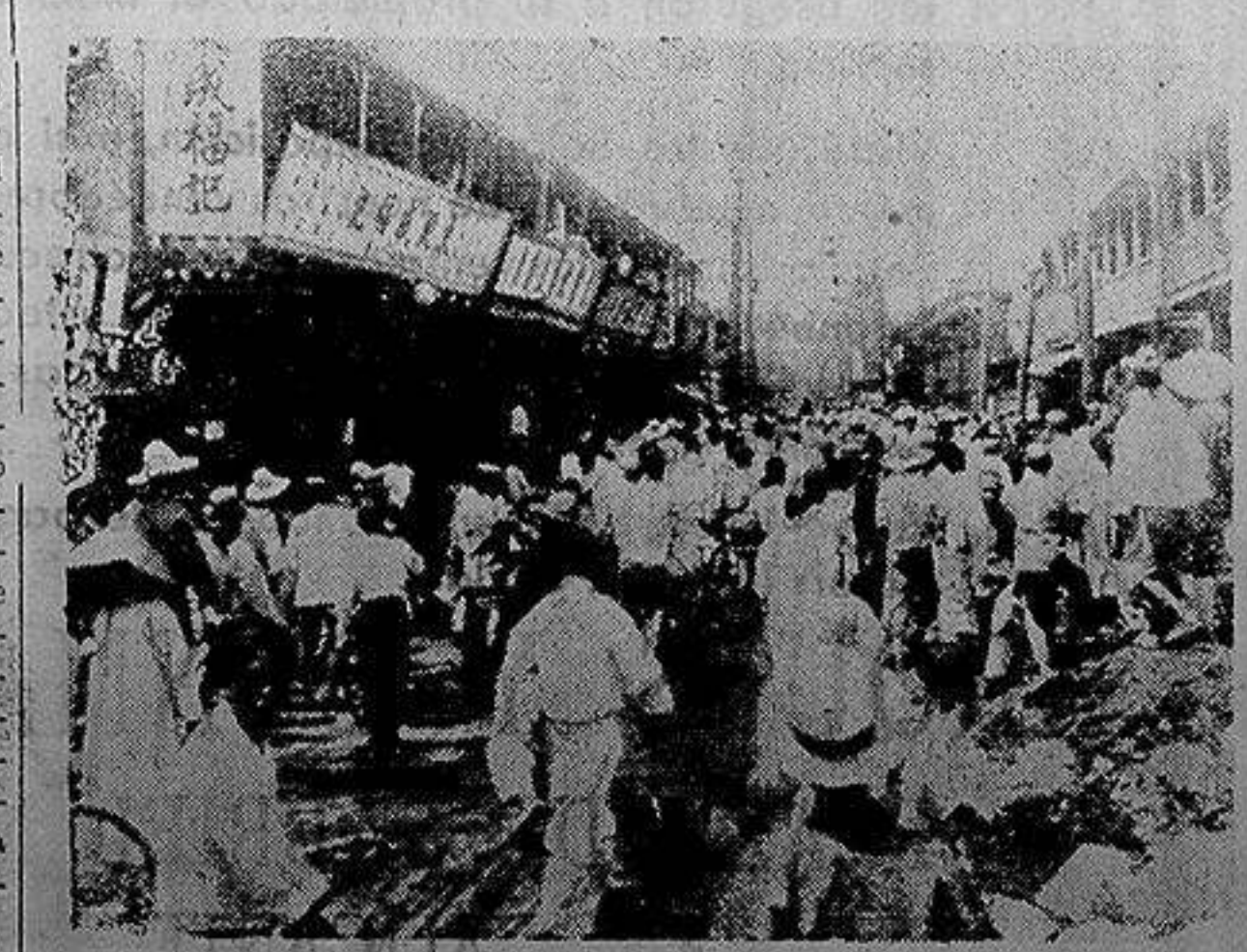
El Conflicto Chino-Japonés.—La calle principal de Kirin, ciudad de la cual acaban de apoderarse las tropas japonesas.

Una producción A. F. A. Tempestad en el Montblanc Muy interesante HOY en el IDEAL