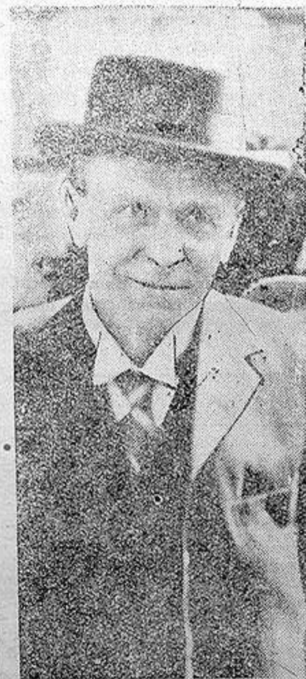
Ginebra.—Lord Cecil, jefe de la delegación inglesa en Ginebra.

EDUARDO ORTEGA Y GASSET (Prohibida la reproducción.)