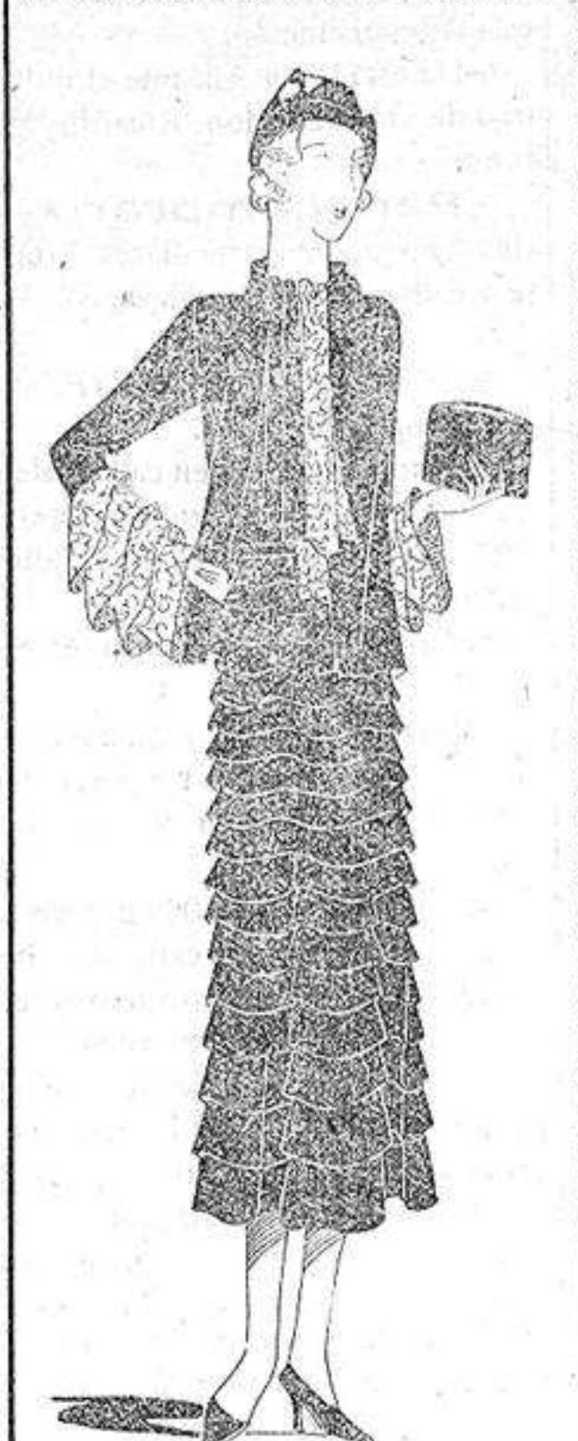
Vestido de crepé marocain negro, todo a volantes. Paletot sin mangas y adornado con un echarpe de puntilla y crepé. Las mangas adornadas con volantes de puntilla.

En los nuevos modelos el descote queda siempre subrayado por un detalle de corte o por un adorno cualquiera. Los modistos nos proponen trajes abiertos por la espalda, desde los hombros hasta la cintura, y que llevan grandes vueltas trapeadas retenidas por una hebilla al nivel de la cintura, y que luego se abren en forma de abanico. También nos presentan un amplio volante capa que va sujeto a la espalda a lo largo del descote. Unos ramilletes de flores prendidos en la parte superior de los trajes destruyen el redondeado regular de los descotes