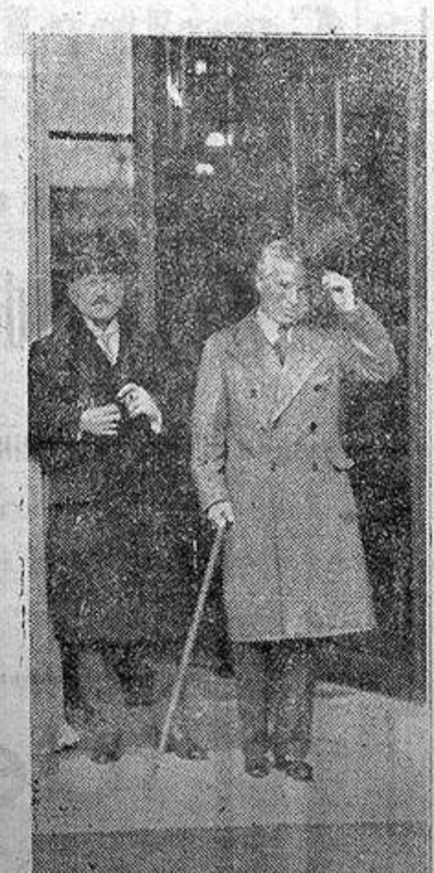
Paris. — Charlot saliendo del Eliseo después de la comida que le fué ofrecida por M. Briand.

LUIS ARAQUISTAIN (Prohibida la reproducción).