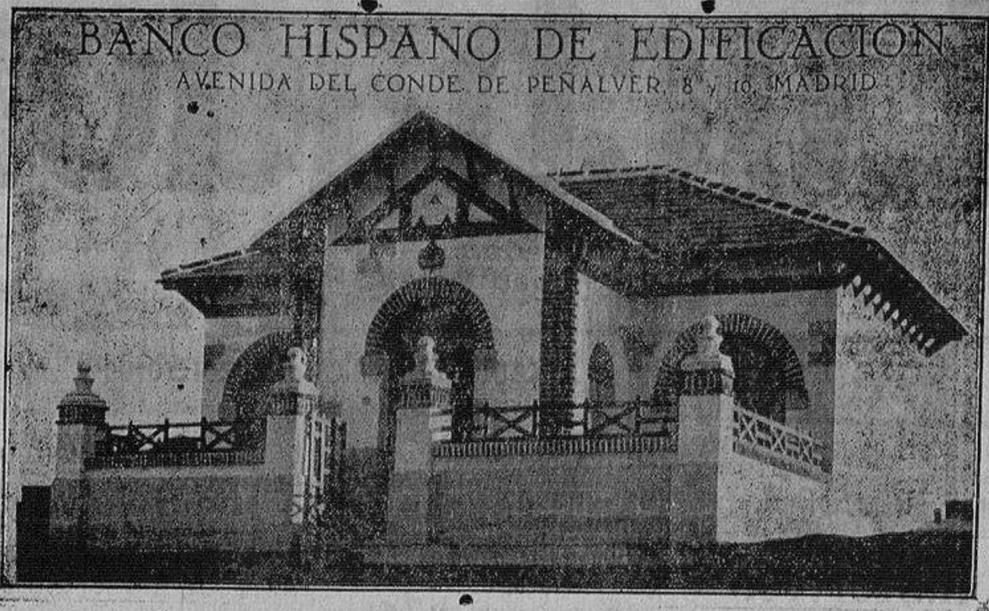
Magnífico Chalet lujosamente amueblado situado a la derecha del paseo de Extremadura en la Colonia de la Real Casa de Campo de Madrid...

ARTICULOS para CAZA EFECTOS DE PESCA SAGASTA, 5 - ALICANTE