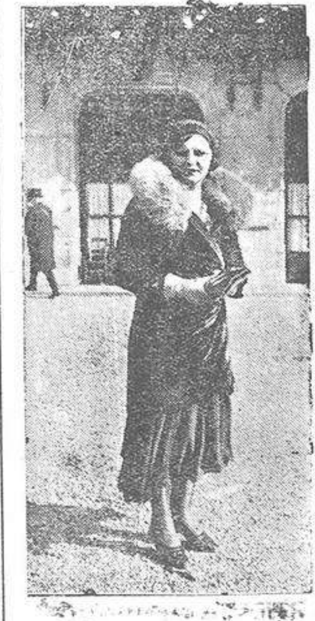
Paris.—Modelos de Otoño en Longchamp.—Abrigo de terciopelo de seda adornado con zorro, llevado con un vestido de crepe de china.

«La Voz de Levante» dice que ayer fué presentado un proyecto para la construcción de una gran estación central para autobuses, con cuya construcción se evitará que Alicante sea una monumental cochera.