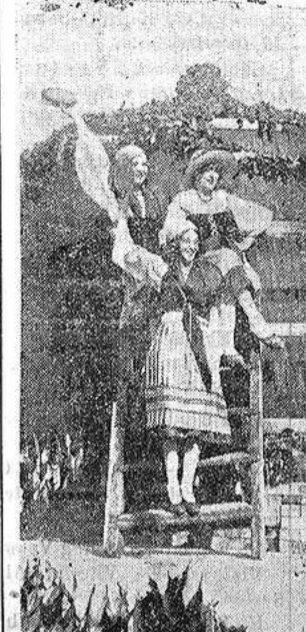
La Fiesta de la Vendimia en Florencia.—Un grupo de lindas vendimiadoras con su traje regional, delante de una cuba repleta de racimos

Una prueba más de la justicia con que el pueblo otorga admiraciones y anatemas: la unánime y conmovedora ovación con que la