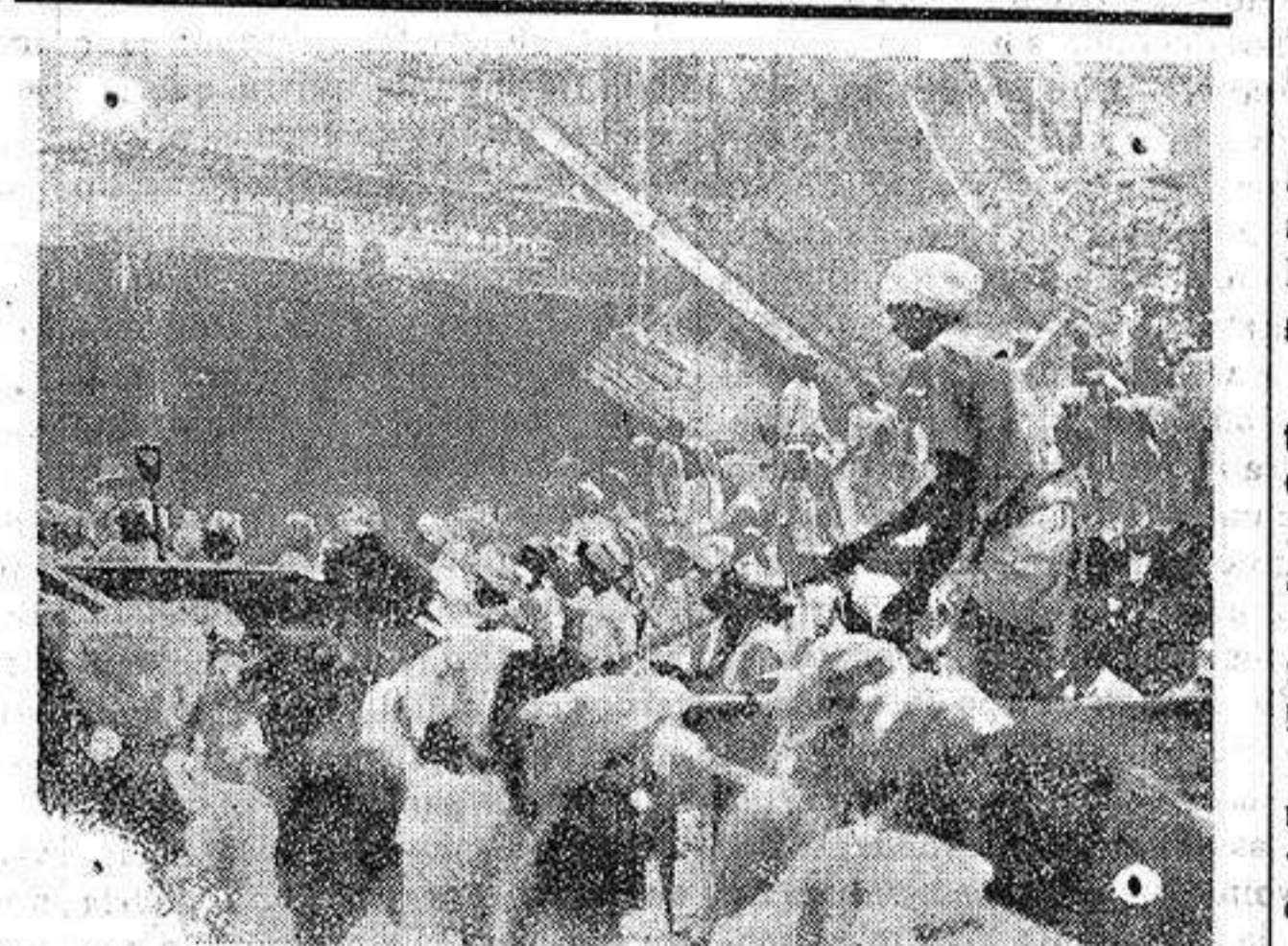
Rangoon.—Los tumultos entre coolies indios y barmanes. Un almacén destruido.

Concesión de certificado de productor nacional a la C. A. Alicantina de Cementos Portland de Alicante.