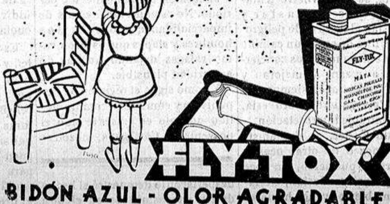
BIDÓN AZUL - OLOR AGRADABLE

Hoy día... matar bichos... juego de ninitos es.