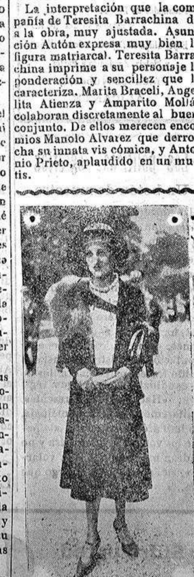
Uno de los últimos modelos visto en las carreras de Longchamps, que ha llamado la atención a las elegantes que ha asistieron a dicha fiesta.