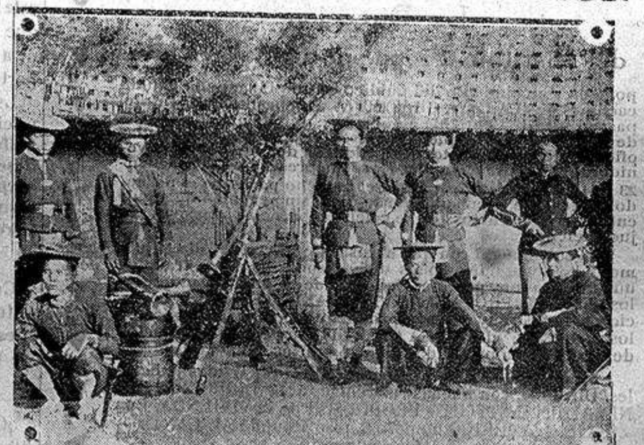
Informaciones Curiosas.—Guarda Indochina civil e indígena, tambores y clarinetes.

Pero, ante todo, a pesar de todas las cosas, triunfo, fué glorioso. Fué, (y lo será siempre), uno de los primeros maestros en la novela, en la poesía, en el teatro y en el periodismo... Joaquín Dicenta es sin duda ninguna un verdadero artista ya que lo mismo escribía un artículo para pe-