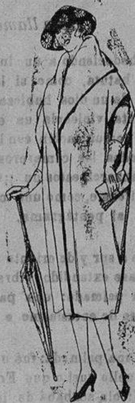
Capas de gabardina, pañete etc. diferentes colores. de ptas. 127 a 15

PRECIO FIJO PIDASE EL CATALOGO GENERAL VENTAS AL CONTADO