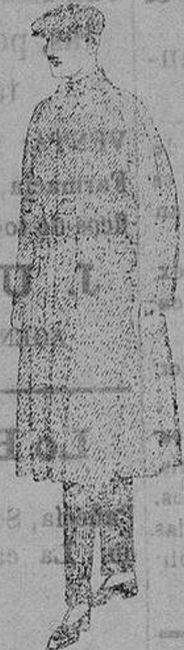
Gabanes de patén, cheviot o cower. de ptas. 90 a 140