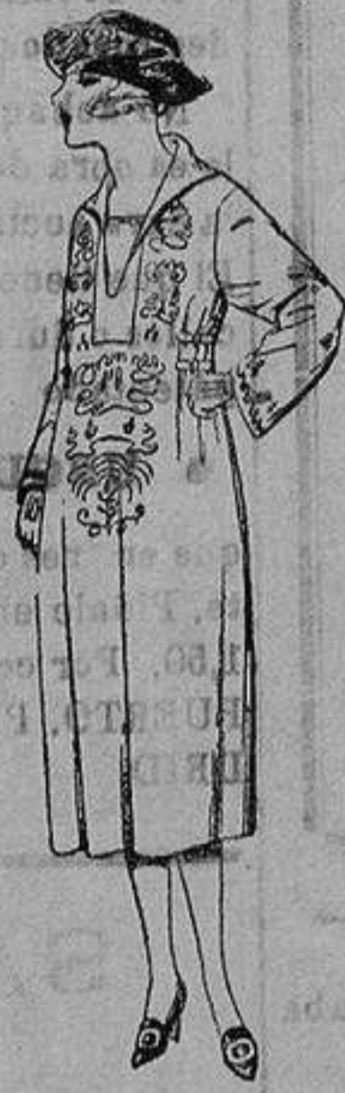
Vestidos de lã, es tambre, gabardina, et en negro, azul y color, adornos bordados. de ptas. 98 a 120