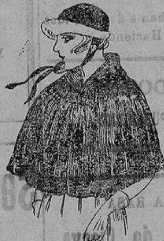
Cuellos forma capa, de piel. Colombia marrón de ptas. 150 a 200