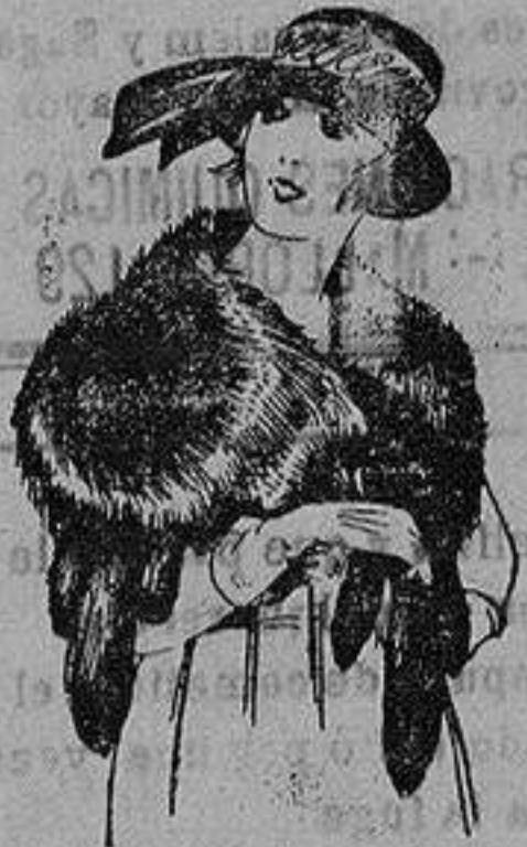
Cuellos para jovencitas, imitación Renardina. de ptas. 22 a 40