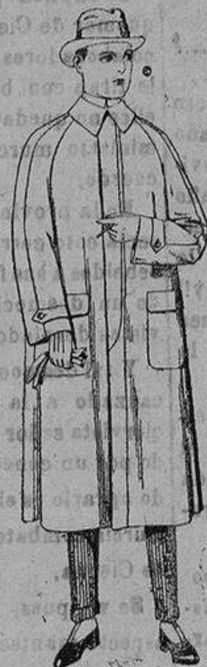
Imprmeable raglan, en azul y colores. de ptas. 45 a 190