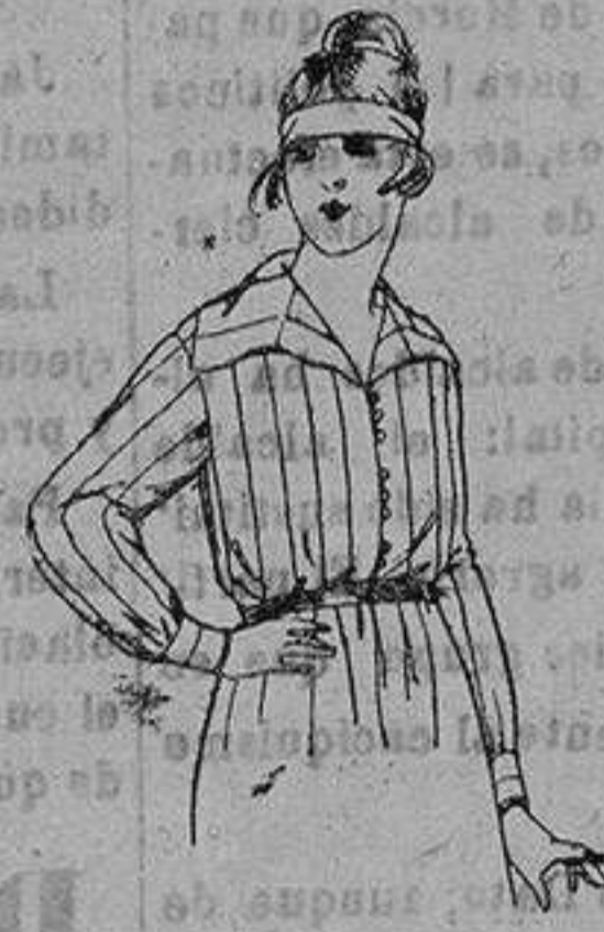
Blusas de franela listadas. de ptas. 9 15