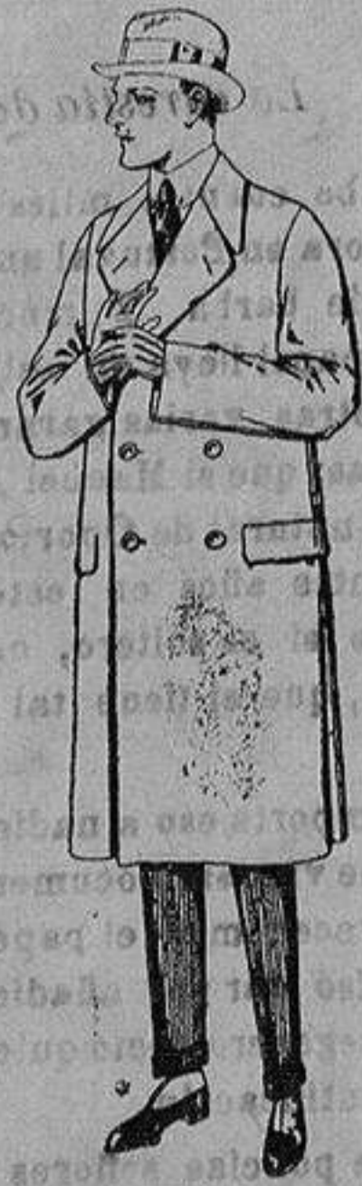
Gabanes de patén, gamuza o cower. de ptas. 70 a 190