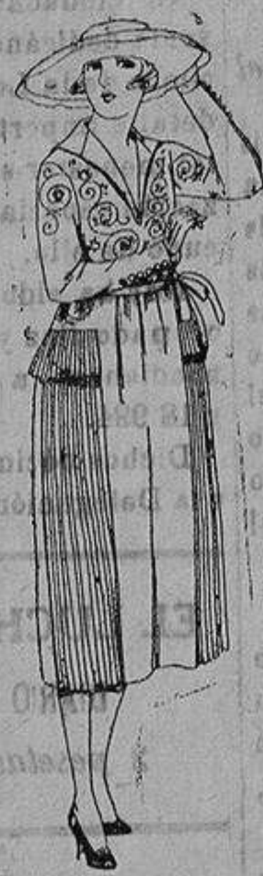
Vestidos de lanilla, gabardina, estambre, etc. en negro, azul y color, adornos bordados. 110 de ptas. 150