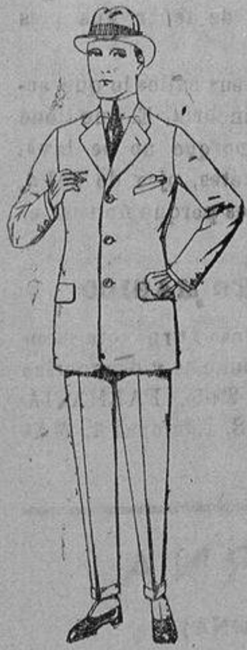
Trajes de cheviot, corte elegante, para Sportman. de ptas. 60 a 190

Sucursales: Madrid, Barcelona, Almeria, Bilbao, Cádiz, Cartagena, Gijón, Granada, Málaga, Palma de Mallorca, Santander, Sevilla, Valencia, Valladolid, Zaragoza