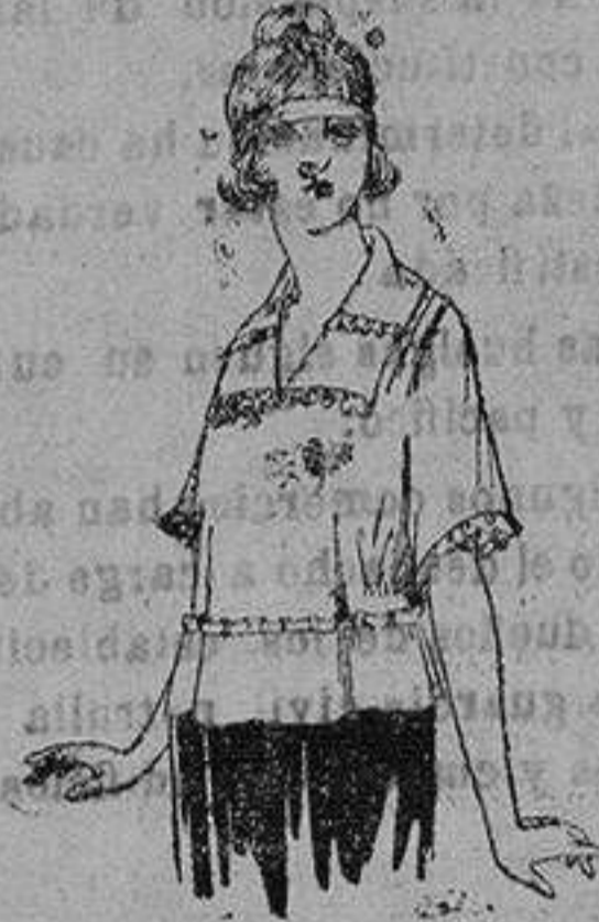
Blusas de crespón de seda, granadine, charmeuse, etc. de ptas. 48 a 70