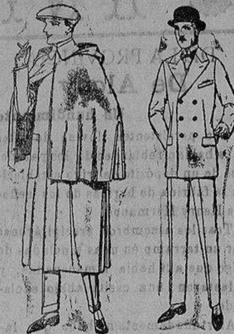
Impermeables mack-ferland en negro y azul de ptas. 35 a 157