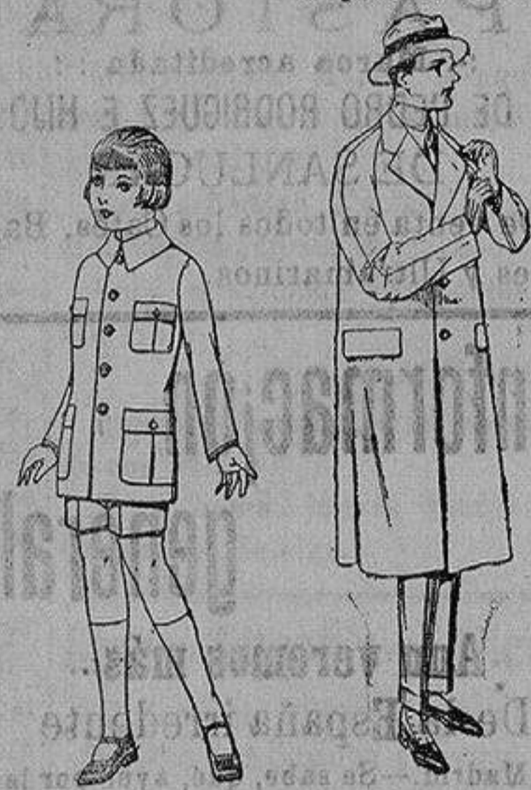
Trajes de patén modelo Sport, para niños de 4 a 9 años. de ptas. 22 a 35.