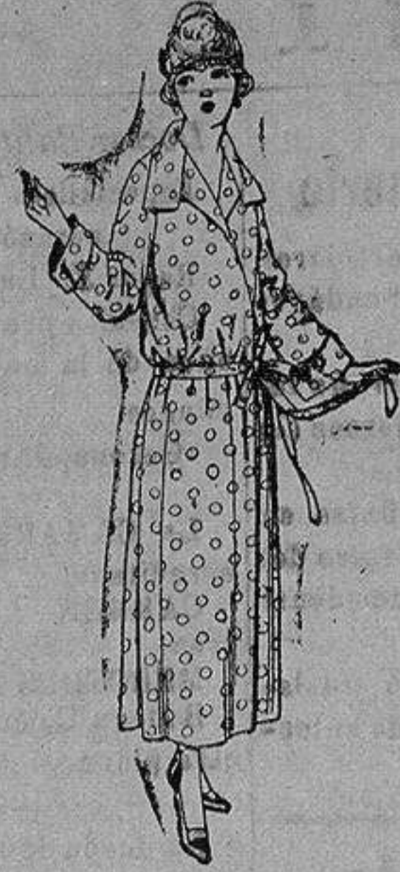
Batas de percal, voile listado, etcétera. de ptas. 16 a