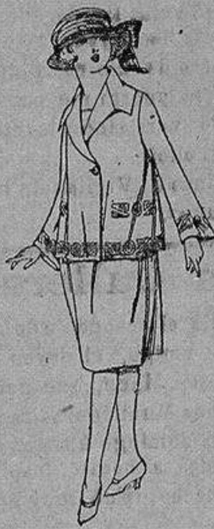
Vestido gabardina-sarga inglesa etc. en azul y color, adornos bordados para jovencitas de 13 a 15 años. de ptas. 93 a 100