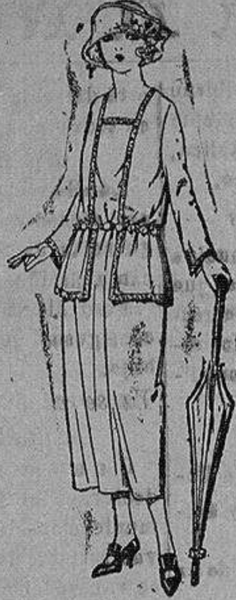
Vestido de gabardina, sarga inglesa etc. en negro, azul y color, adornos cinta seda. de ptas. 63 a 90