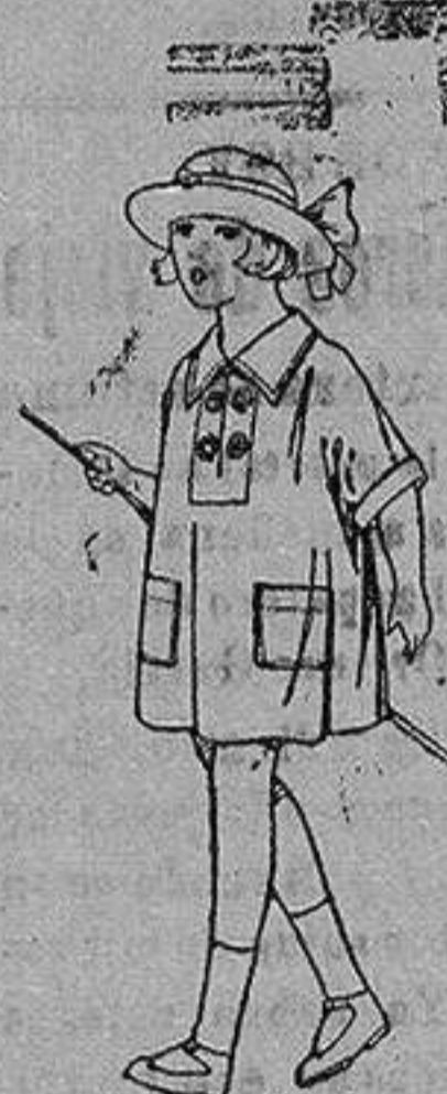
Vestidos de batista blanca, adornos bordados para niñas de 3 a 6 años de ptas. 6 a 8

Boas, Camisería, Géneros de punto Corbatería, Guantería, Sombrerería Zapatería, Paraguas, Bastones y Artículos de Viaje