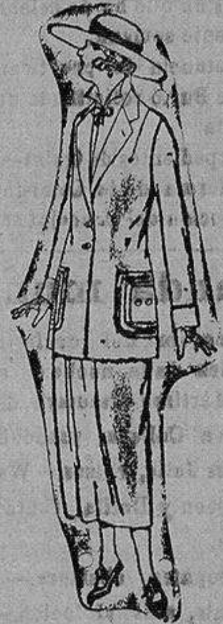
Trajes sastre de popeline gabardina etc. adorno, pespuntes seda, chaqueta forrada deseda en negro, marrón decolores moda ptas. 120 a 140.