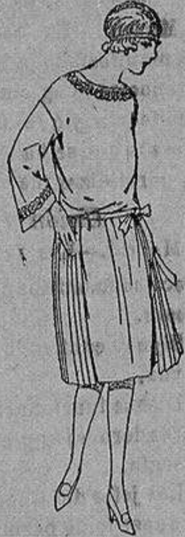
Vestidos de papeline, sarga, etc. en azul y color adornos bordados para jovencitas de 13 a 15 años. de ptas. 60 a 78