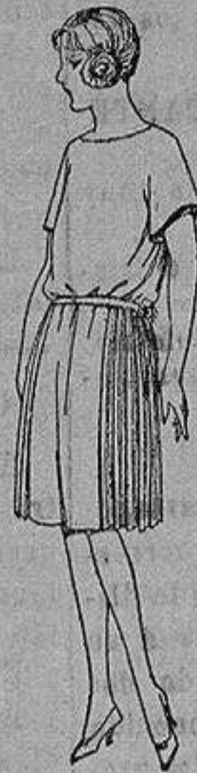
Vestido sarga inglesa gabardina, etc., en azul y color, adorno de pespuntes seda. de ptas. 55 a 110