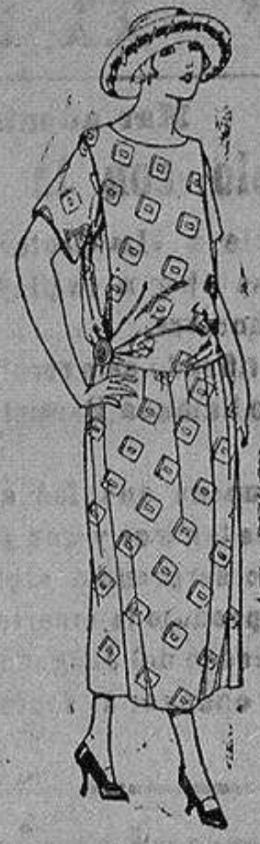
Vestido de foulard de algodón dibujo fantasía. de ptas. 85 a 50