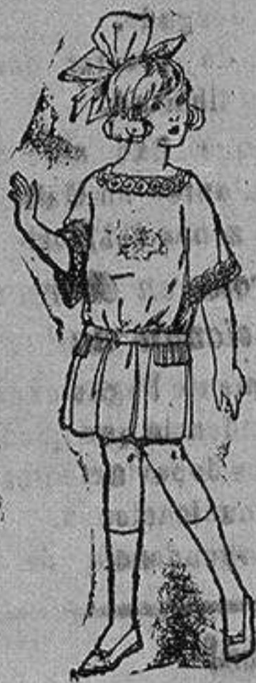
Vestido de sarga, peline inglesa, en azul y colores moda, para niñas de 4 a 9 años. de ptas. 38 a 8

Ropas confeccionadas para Caballero, Señora, Niño y Niña