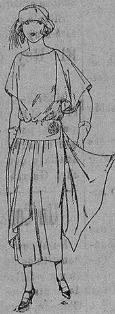
Vestido de crespón de china, en negro, azul y colores moda, adornos bebillas de metal. de ptas. 185 a 160