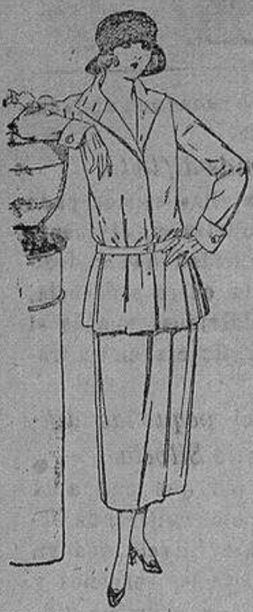
Traje sastre de estambre gabardina, etc., chaqueta forrada de seda en negro marino y colores moda. de ptas. 115 a 145

Sucursales: Madrid, Barcelona, Almeria, Bilbao, Cadiz, Cartagena, Gijón, Granada, Málaga, Palma de Mallorca, Santander, Sevilla, Valencia, Valladolid, Zaragoza