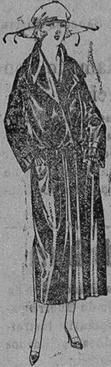
Abrijo de seda impermeables, en negro, azul y color. de ptas. 130 a 225