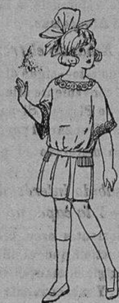
Vestido de sarga popelina inglesa, en azul y colores moda, para niñas de 4 a 9 años. de ptas. 33 a 38

Ropas confeccionadas para Caballero, Señora, Niño y Niña