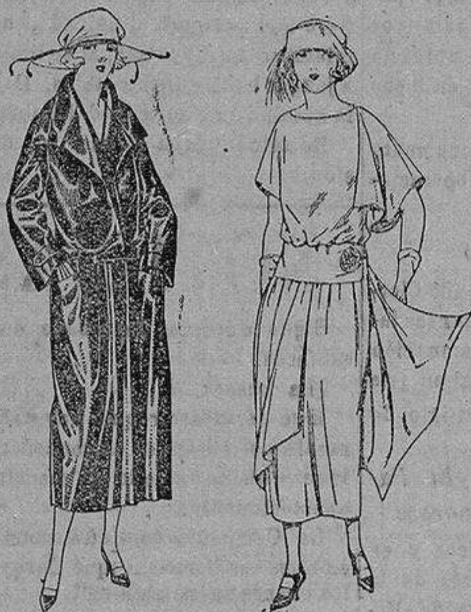
Abrigo de seda impermeables, en negro, azul y color. de ptas. 130 a 225