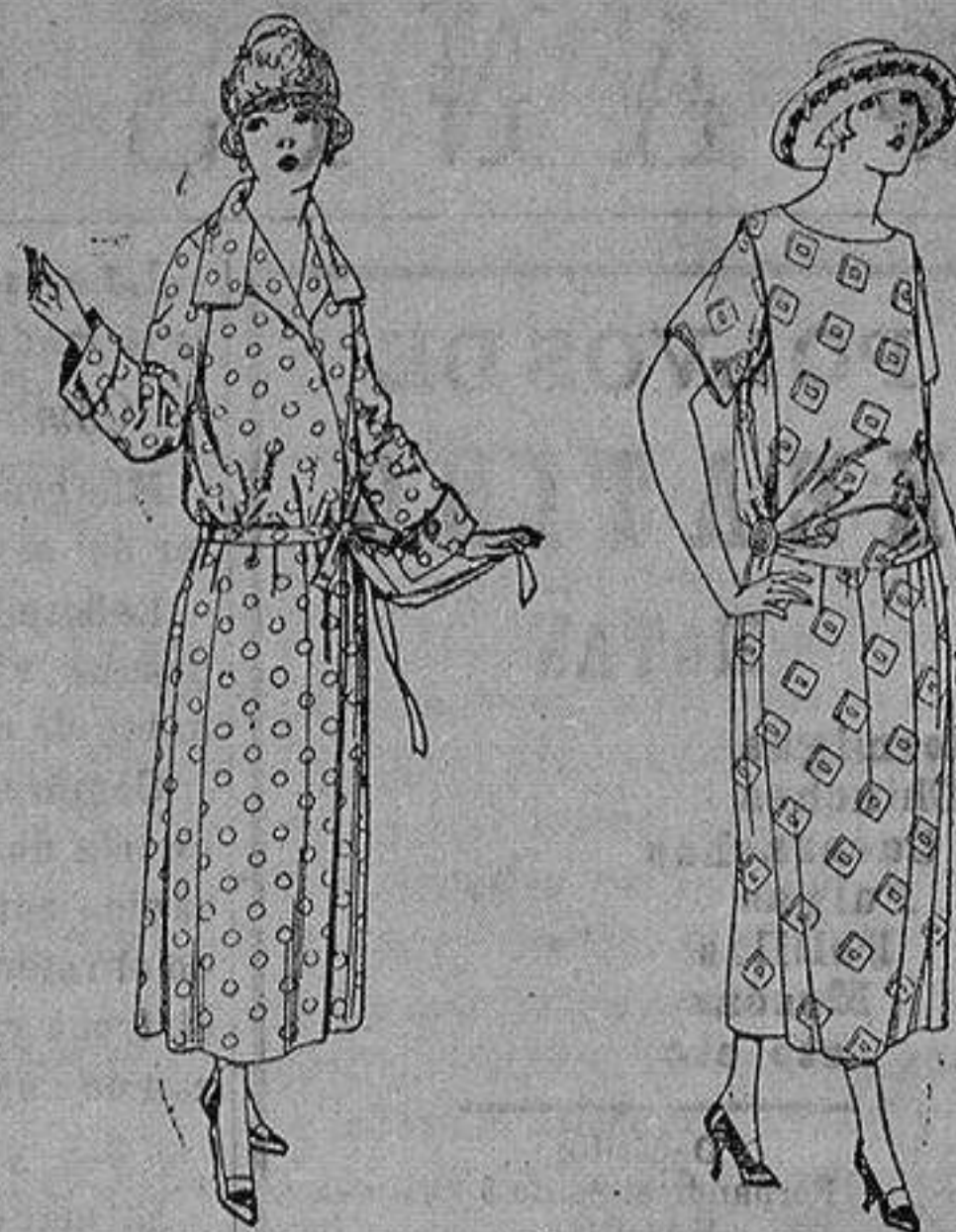
Batas de percal, voile listado, etcétera. de ptas. 16 a 28