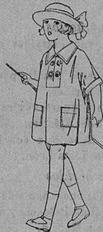
Vestidos de batista blanca, adornos bordados, para niñas de 3 a 6 años de ptas. 6 a 8

Boas, Camisería, Géneros de punto Corbatería, Guantería, Sombrerería Zapatería, Paraguas Bastones y Artículos de Viaje