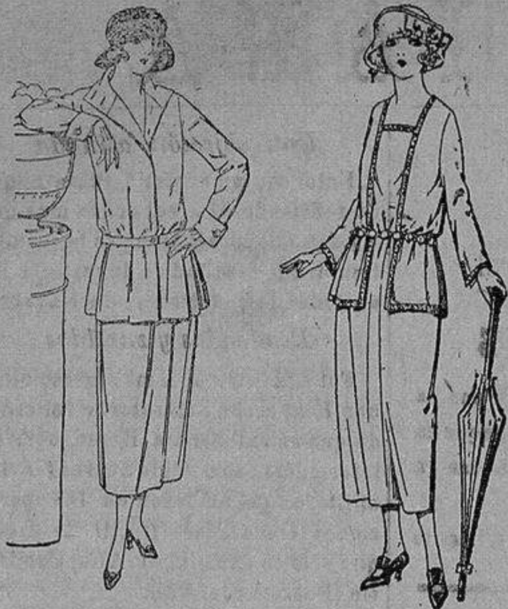
Traje sastre de estambre gabardina, etc., chaqueta forrada de seda, en negro marino y colores moda. de ptas. 115 a 145

Sucursales: Madrid, Barcelona, Almeria, Bilbao, Cadiz, Cartagena, Gijón, Granada, Málaga, Palma de Mallorca, Santander, Sevilla, Valencia, Valladolid, Zaragoza