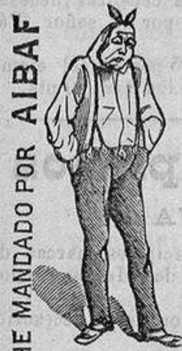
HE MANDADO POR AIBAF