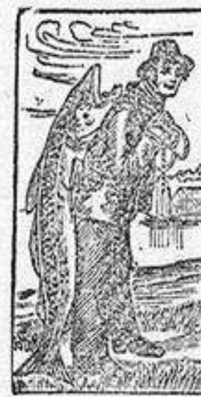
Marca de fábrica.

no descuidar un catarro pues puede ser precursor de pulmonías, de la Tisis, ó de otras graves enfermedades. La Emulsión de Scott cura el catarro, sana la irritación de la garganta y los pulmones, fortifica y robustece el organismo. Es una combinación de los dos agentes curativos, aceite de hígado de bacalao é hipofosfitos, reconocidos universalmente por los médicos como los más poderosos en las enfermedades extenuantes y especialmente para los Niños. Exijase la legítima