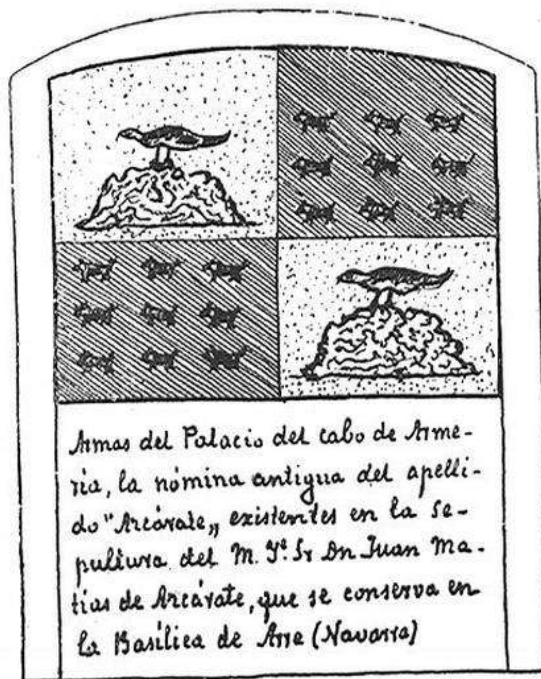
Escudos nobiliarios de la familia de Fray Diego de San Cristóbal