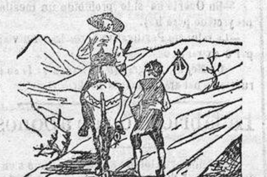
—Tengo una memoria tan fatal que mañana ya no me acordaré de nada de lo que hoy he hecho.

SERVICIO PARROQUIAL DE ENFERMOS. San Nicolás.—Sr. Coadjutor San Gregorio 17 2º.