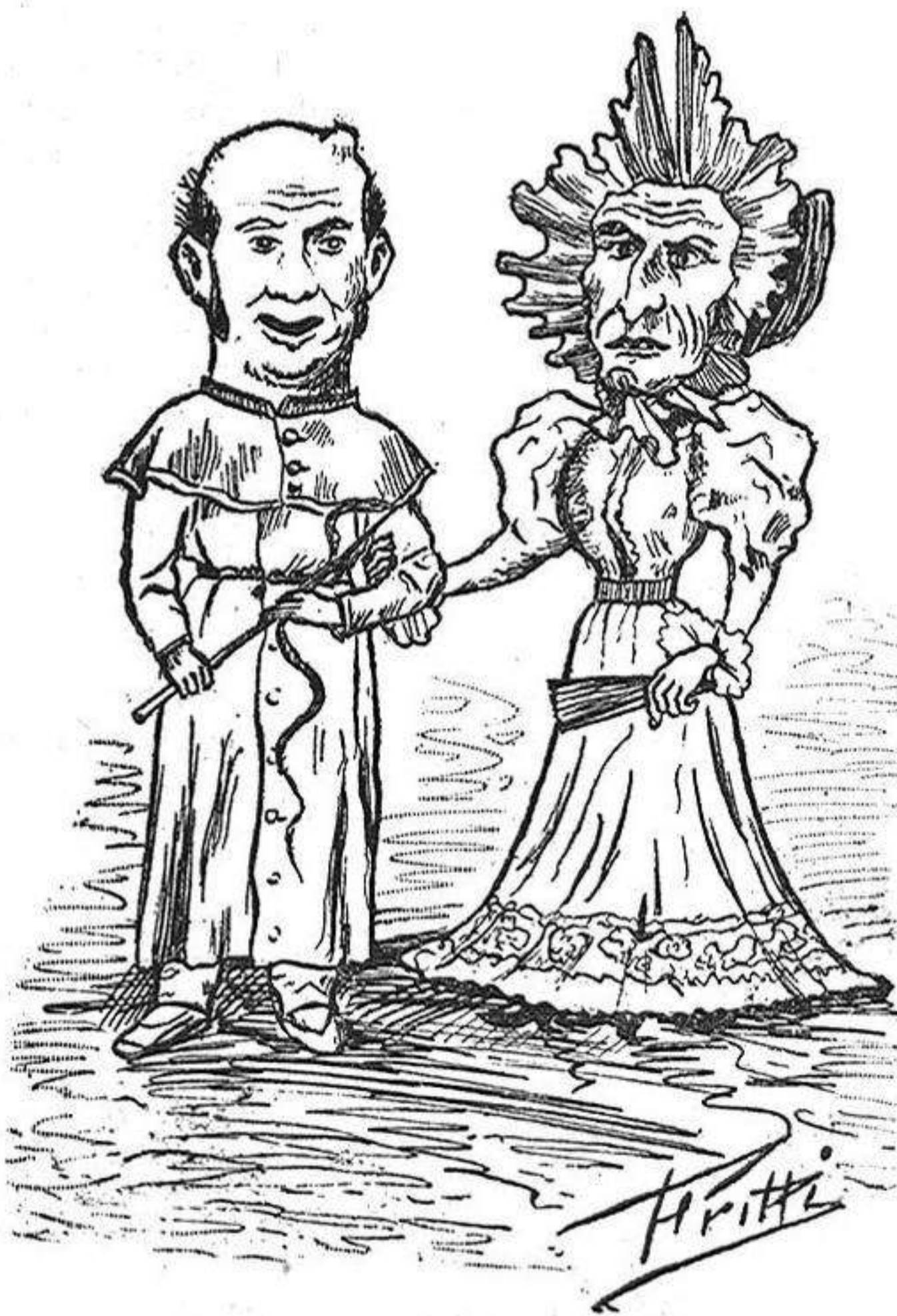
Il Capo di Lupia é la sua donna

Ante di dire quatro cose sopra questi celeberrimi personaggi vigatani, s'iam permeso adilantare una