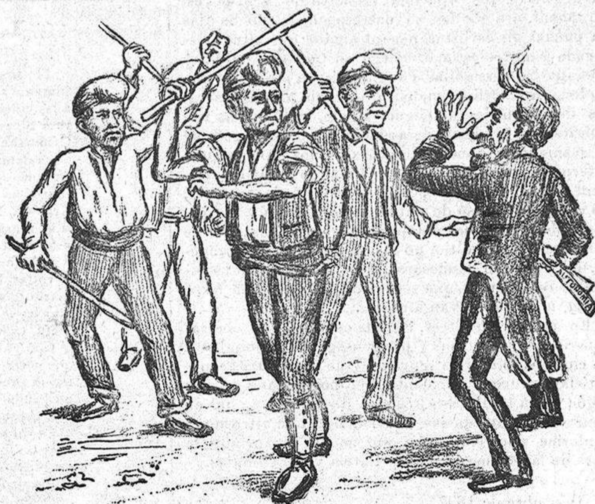
Mes, si algo 's vol consegui, aquests poden ferho així.