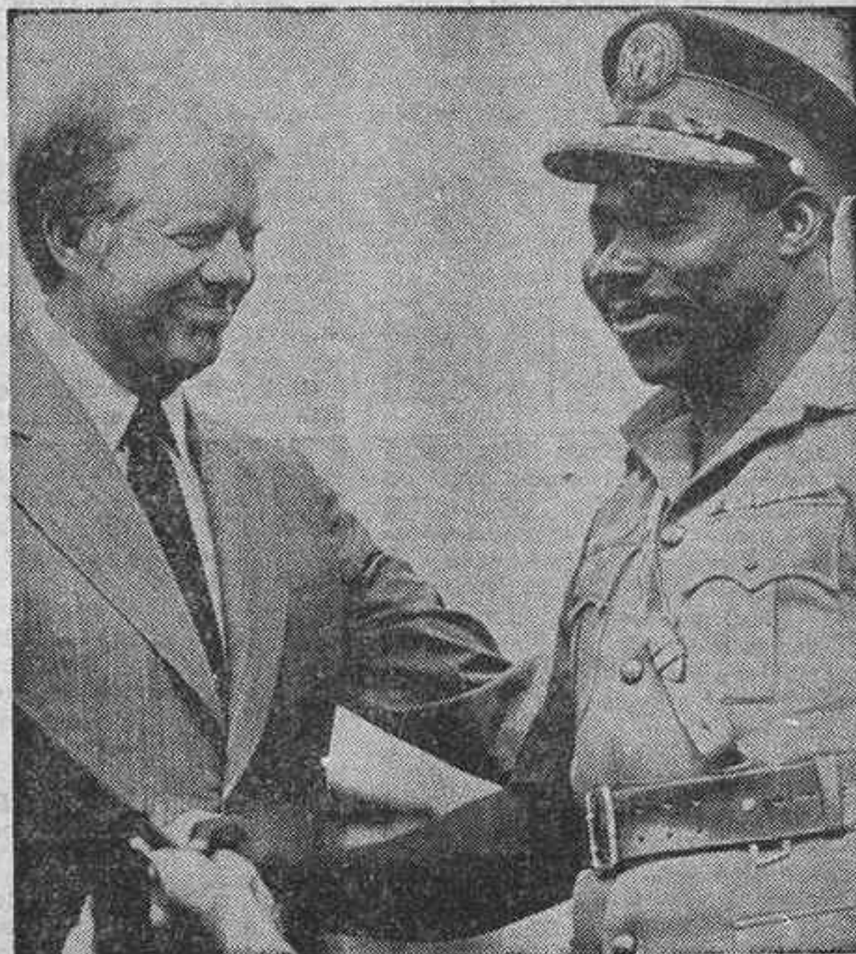
LAGOS. — El presidente Carter saluda al teniente general Olu-segun Obasanjo, jefe del Estado de Nigeria, que le dio la bienvenida durante las ceremonias celebradas en Dodan Barracks.