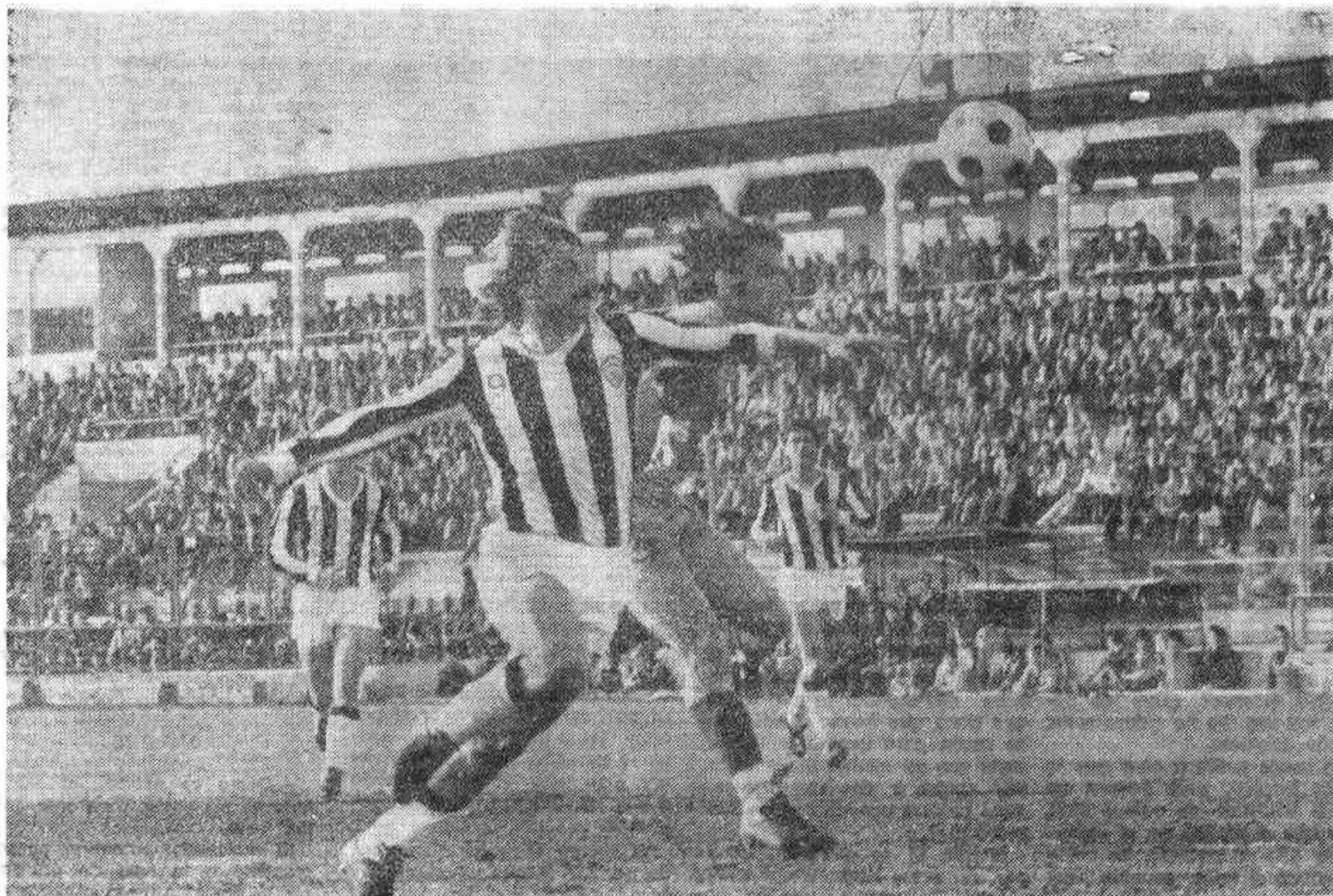
había orden ni concierto. Nadie sabía donde acudir; la defensa casi siempre jugaba a contragol-