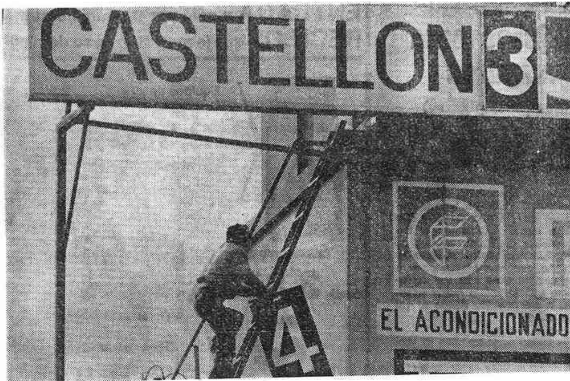
Pues sí, la placa con el gol número cuatro estaba pudriéndose oxidada en el más completo de los olvidos. Desde que éramos pequeños —partido Castellón-Burgos—, no había salido el "4" de su archivo, debajo del marcador.

¡Milagro!, ¡milagro!, gritó el encargado del marcador, han marcado el cuarto gol. ¿Dónde estará la tabla con el número "4"? No la encontraban. Por fin, apareció, toda llena de polvo, de tela raída, de cochambre... rápida, urgente limpieza, y el "4" ocupó el lugar que corresponde al gol número cuatro.