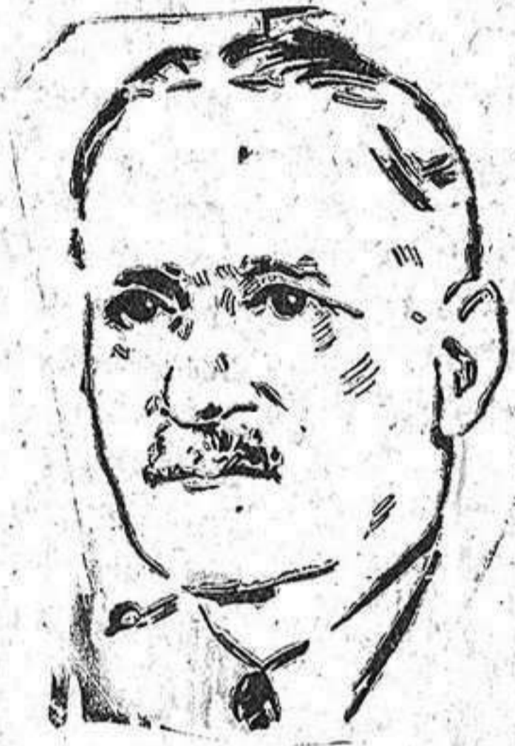
General Spaatz, jefe de las fuerzas de bombardeo norteamericanas.