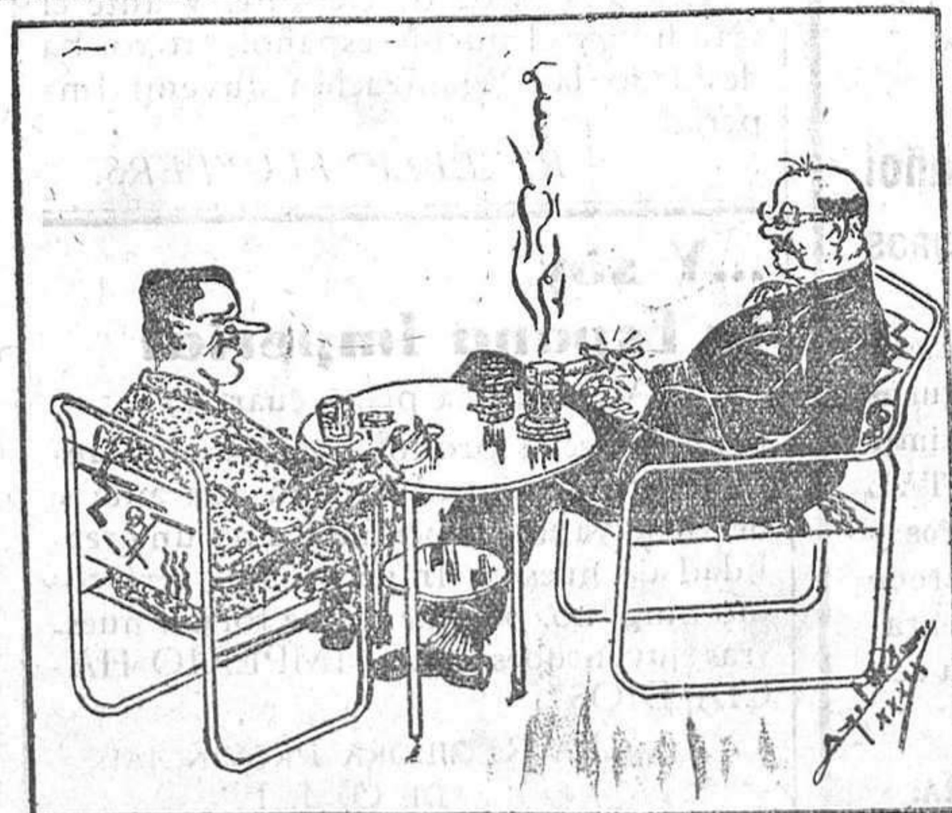
—Porque suscribí con tres reales una Ficha Azul, me pusieron verde.

Toda la ciudad amaneció engalanada anteayer, domingo, y en los escaparates de los comercios, había grandes retratos de Franco rodeados de banderas nacionales.