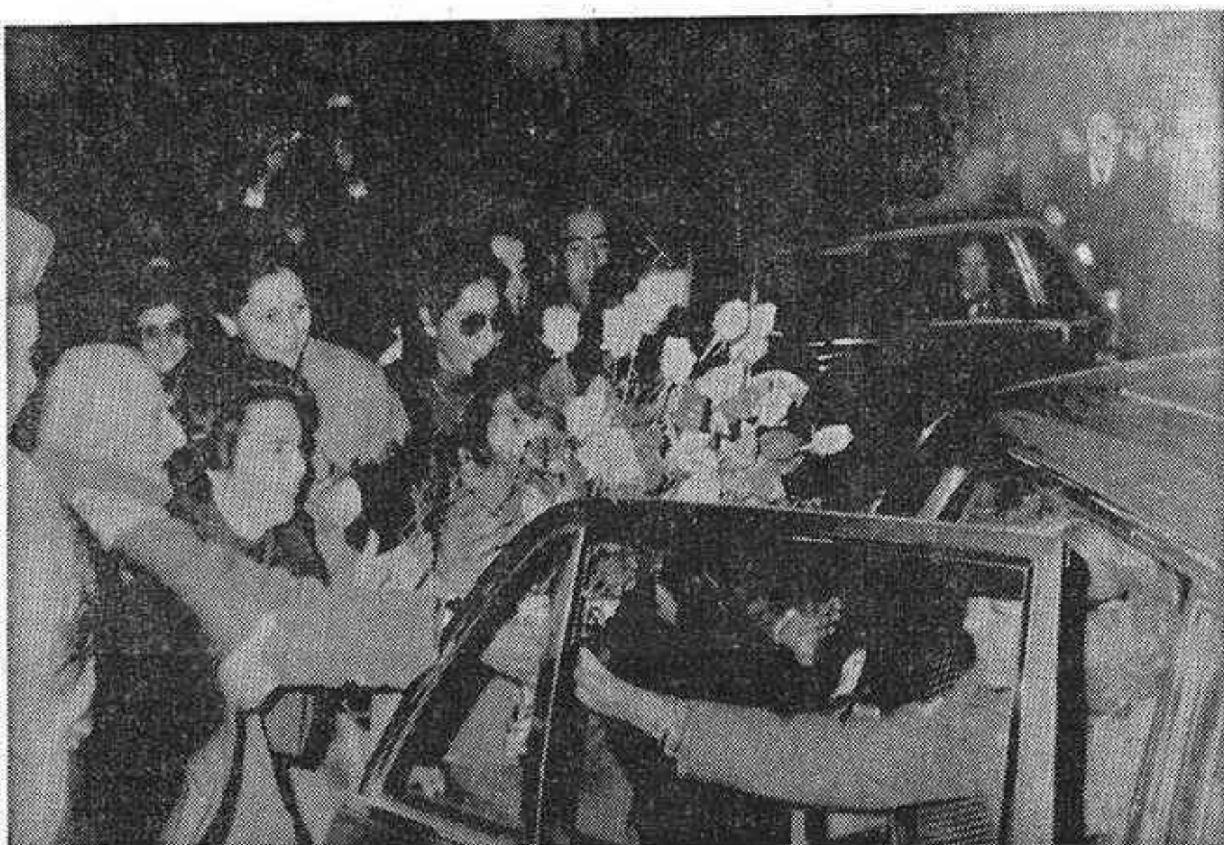
En la foto, un anciano ofrece un ramo de flores a la Reina doña Sofía, al paso de los Monarcas por las calles de Jaén camino de la Catedral.

Don Juan Carlos y doña Sofía, entusiásticamente recibidos en Linares, Baeza y en Granada