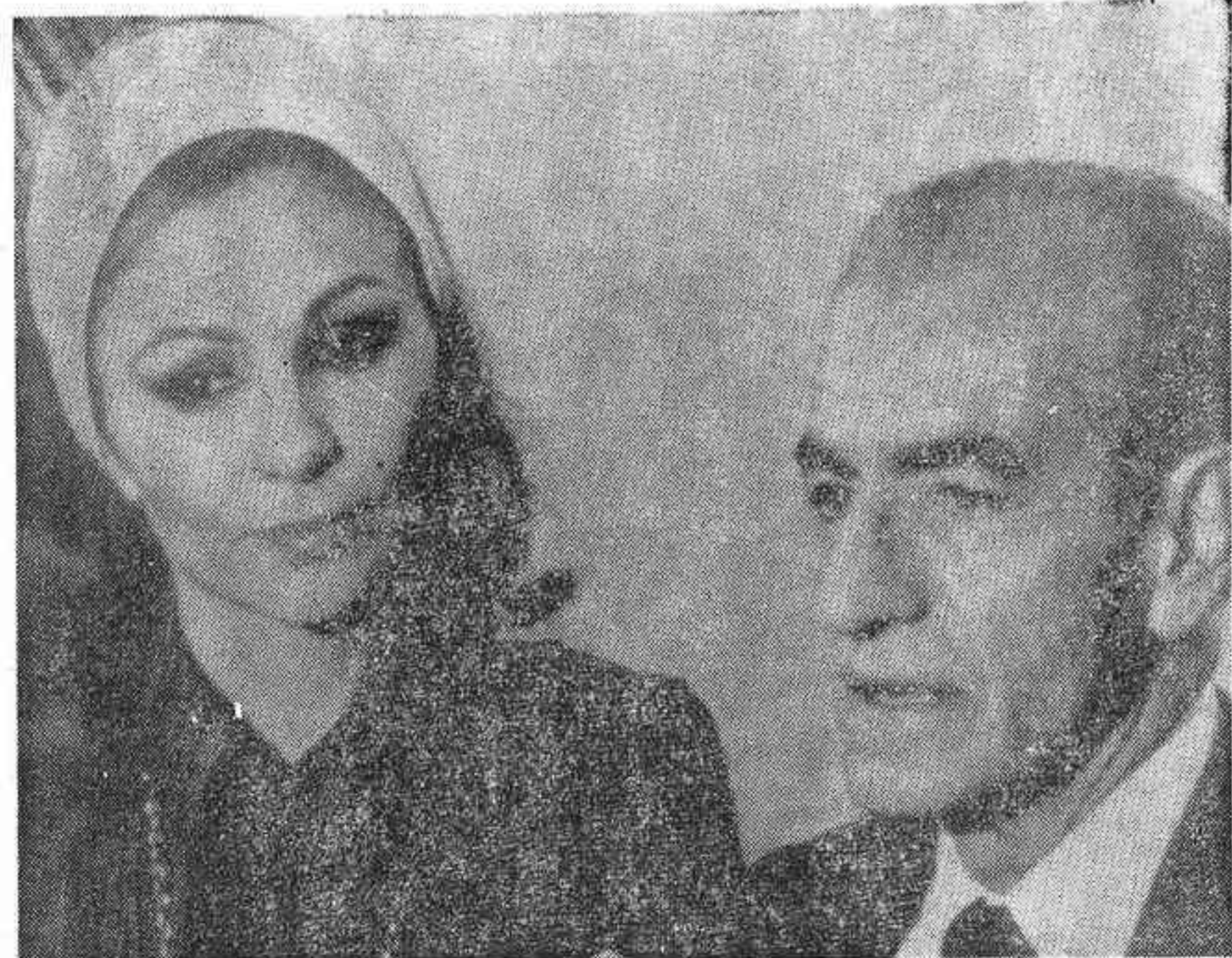
mas, Cuernavaca, Nueva York... un largo camino sin descanso. Siempre perseguido y amenazado. El Ayatollah Jomeini acaba de declarar: «Vuele donde vuele

el depuesto Sha, el pueblo iraní le perseguirá».