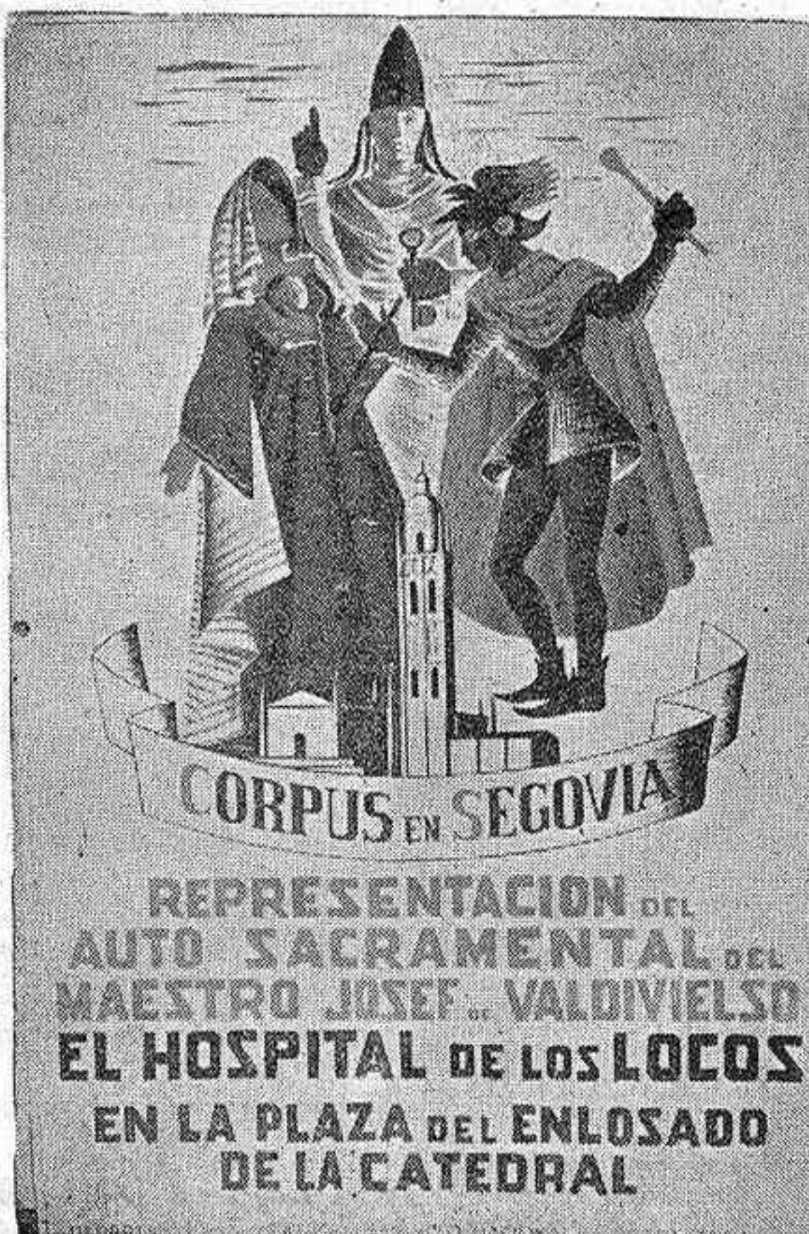
REPRESENTACION DEL AUTO SACRAMENTAL DEL MAESTRO JOSEF VALDIVIELSO EL HOSPITAL DE LOS LOCOS EN LA PLAZA DEL ENLOSADO DE LA CATEDRAL

El Departamento de Teatro del Servicio Nacional de Propaganda ha restablecido, en las sacras fiestas del Corpus Christi, una de las tradiciones más genuinamente españolas, y por lo mismo más plenas, de nuestros pasados siglos imperiales: la representación de autos sacramentales, que tienen como fondo y asunto la exaltación del dogma de la Eucaristía. Y ha elegido precisamente para la representación la castellanesca ciudad de Segovia, una de las de más rancia solera en estas poéticas escenificaciones del más prodigioso Misterio de nuestra Religión.