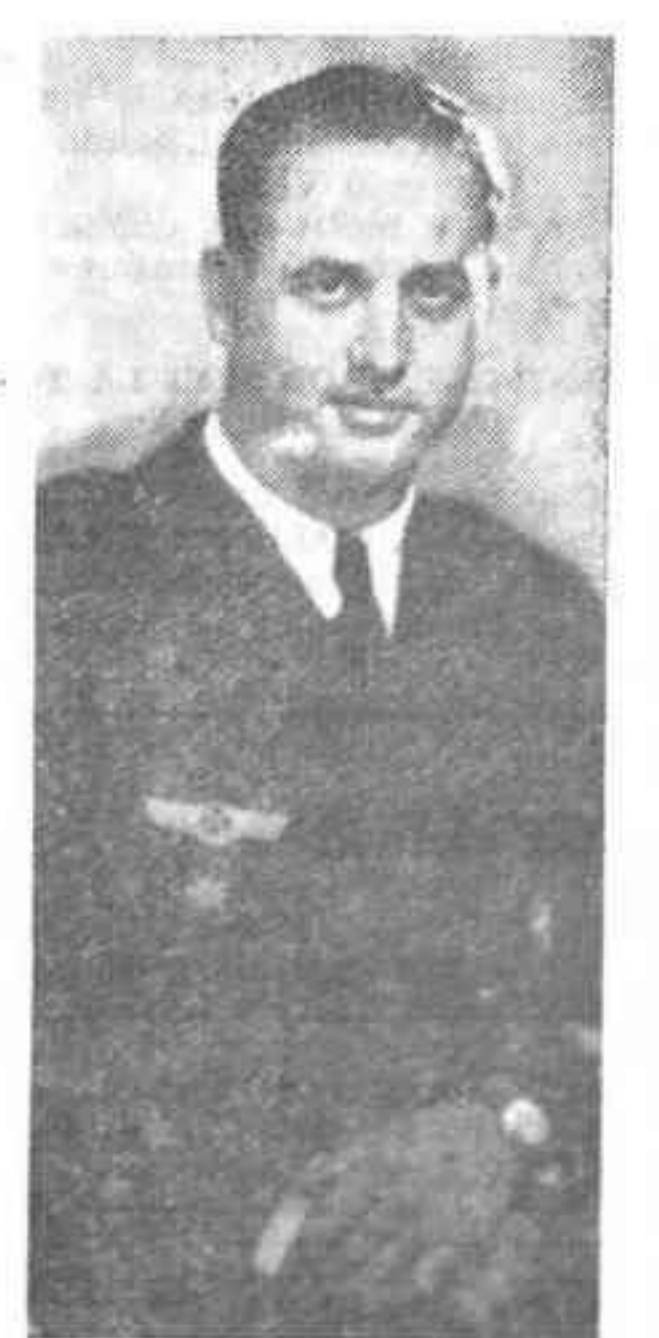
El laureado as de la Aviación nacional, comandante Garcia Morato

parte de ellos, no se ha dejado sentir el hambre intensamente, como la sienten en Madrid, Barcelona y Valencia. Es frecuente encontrar en las casas de los catalanes aceite en abundancia, huevos, gallinas y hasta carne en conserva, a más de gran cantidad de legumbres. Se ve, pues, que la requisita de alimentos no ha sido ejecutada con rigor. Donde la requisita se hizo con más rigor fué en las fábricas y en los almacenes de azúcar, trigo, etc., en donde la cantidad acumulada era tanta que no se prestaba a ser escondida fácilmente ni mucho menos a negar su existencia. Pero los campesinos catalanes, el pequeño agricultor, en sus casas o masías guardaban tranquilamente no sólo lo preciso para su vida y la de sus fami-