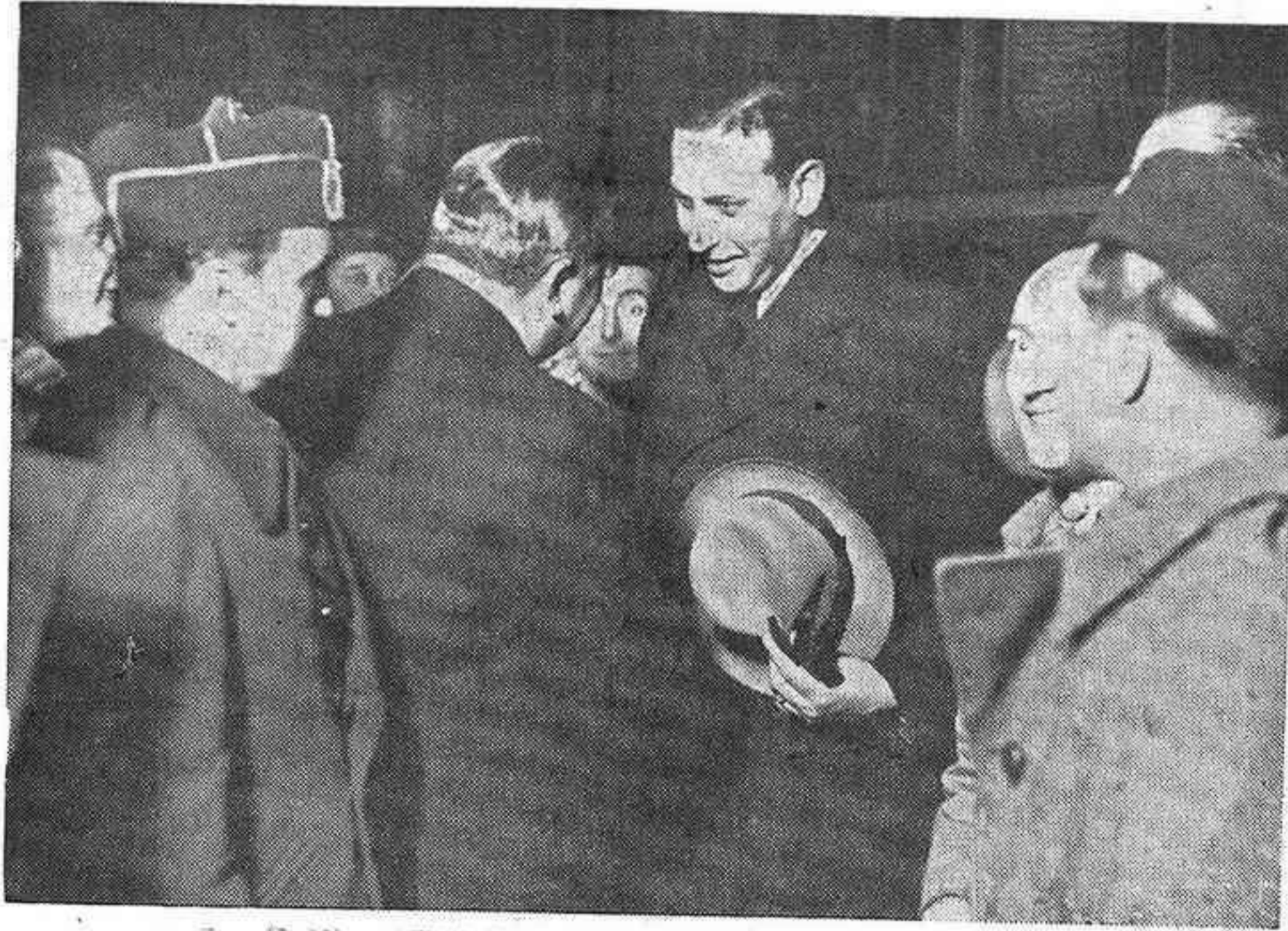
El Dr. Pedro Tooyonio Pereira, representante de Portugal ante el Gobierno del Generalísimo Franco, a su llegada a Salamanca