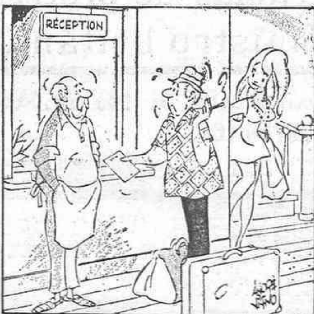
—¿Cómo pone un extra de cuarto de baño si no lo tiene el hotel? —¡Precisamente, es para instalarlo!