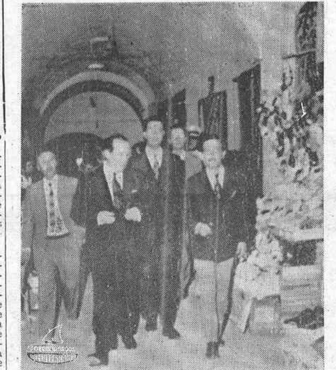
TUNEZ. — El Ministro de Información y Turismo, Sr. Sánchez Bella, acompañado del Embajador español, Alfonso de la Serna y del Gobernador de Cap Bon, visita las típicas «Souks de Nabeul».

TUNEZ, 23. (Efe). — El Ministro de Información y Turismo, D. Alfredo Sánchez Bella, abandonó Túnez esta mañana, por vía aérea, con destino a Madrid, vía Roma, dando por terminada la visita oficial que efectuó a la República Tunecina invitado por el Gobierno.