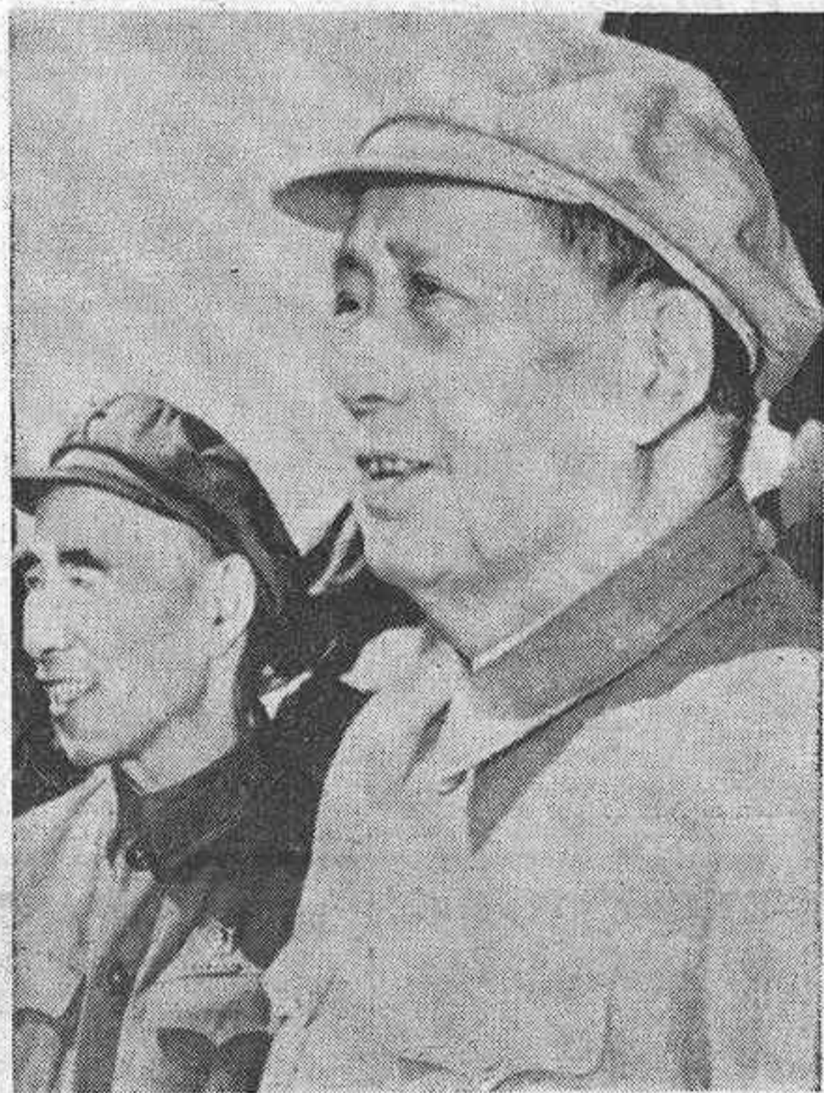
Pekin parece atravesar una situación de emergencia de algún tipo, de acuerdo con fuentes diplomáticas especializadas en asuntos chinos. Dijeron que la explicación posible podría estar en una gravísima enfermedad de Mao o incluso su muerte, pero nada se conoce con certeza. En esta fotografía de archivo, Mao aparece con el Vicepresidente Lin Biao, en 1969.

TOKIO, 23. (Efe-Reuter). — Todos los permisos han sido cancelados en el Ejército chino y los soldados que actualmente los disfrutaban han recibido la orden de reincorporarse a sus unidades, informa hoy el periódico de Tokio «Ashai Shimbun». La medida se cree ha sido adoptada hace unos días a fin de prevenir posible confusión en el país en el caso de un importante anuncio, indican las fuentes.