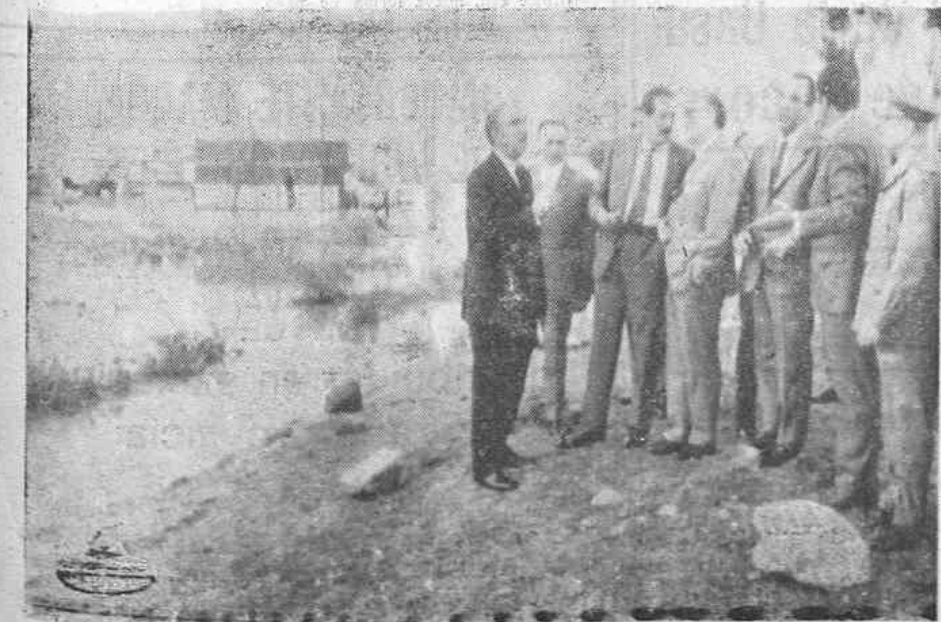
PRAT DE LLOBREGAT. — Varios ministros han comenzado a visitar las zonas afectadas por la catástrofe. En la foto, los de Gobernación, Obras Públicas, Trabajo y Relaciones Sindicales.

BARCELONA, 23. (Pyresa). — Los ministros de la Gobernación, D. Tomás Garciano Goni, de Obras Públicas, D. Gonzalo Fernández de la Mora; de Trabajo, D. Licio de la Fuente; de Relaciones Sindicales, D. Enrique García Ramal, y de la Vivienda, D. Vicente Mortes, se han reunido durante hora y media en el Gobierno Civil, a fin de estudiar la situación creada en la provincia de Barcelona por las recientes inundaciones. Asistieron también las primeras autoridades barcelonesas y de las localidades más afectadas. El acto celebrado a última hora de la tarde, ha sido abierto por el Gobernador Civil y Jefe Provincial del Movimiento, quien hizo un breve resumen de la situación, y que en nombre de la provincia