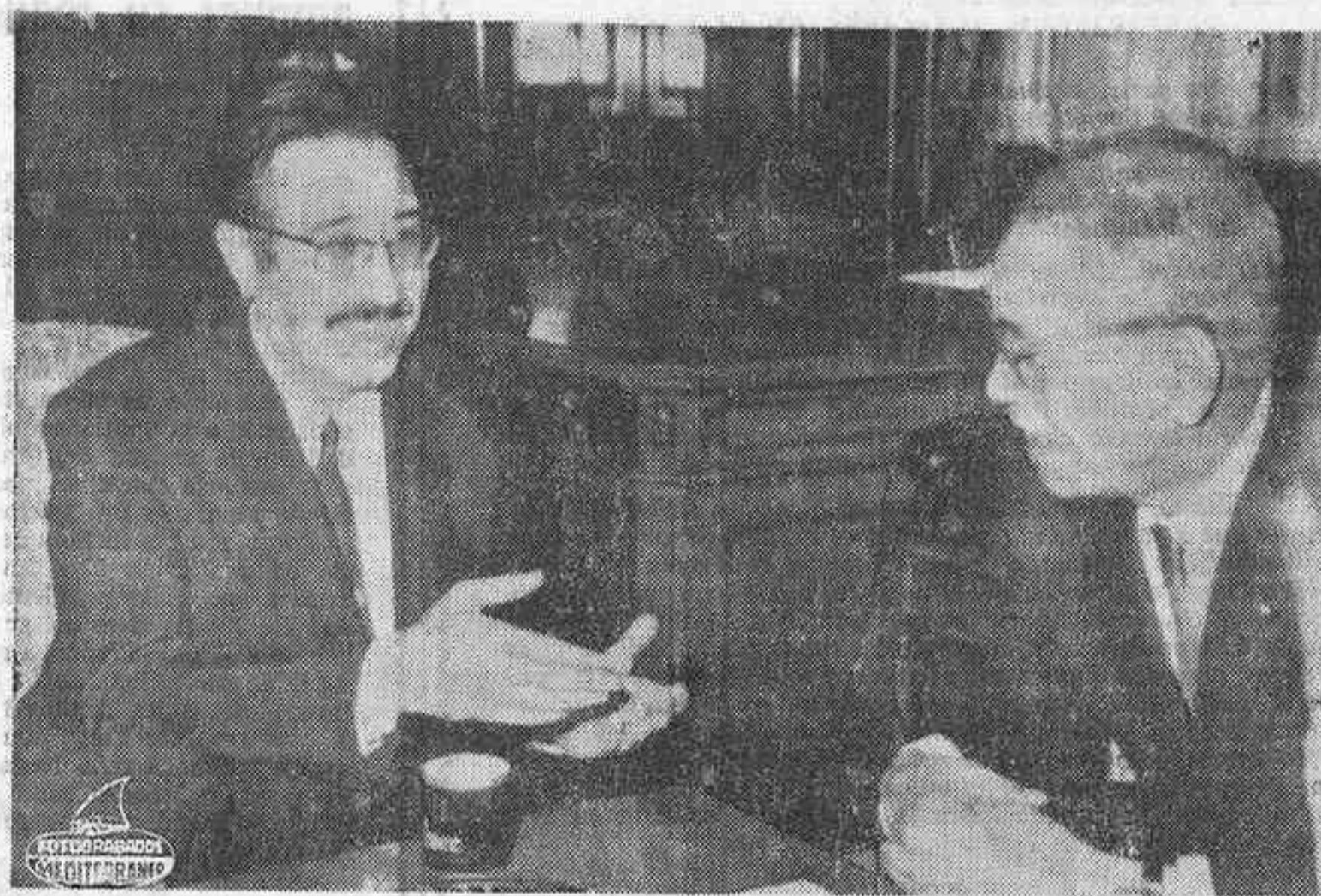
TOKIO. — El Ministro español de Educación y Ciencia José Luis Villar Palasi en la entrevista celebrada en su despacho.

El señor Villar Palasi fue recibido por el Primer Ministro, Eisaku Sato