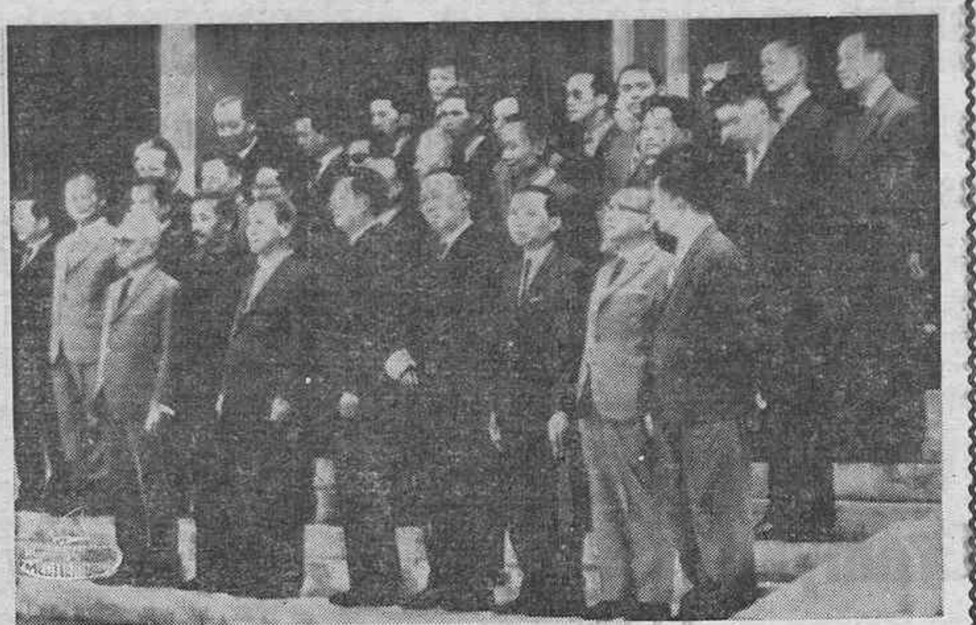
SAIGON. — He aquí al nuevo gabinete formado por 31 hombres, y que componen el Gobierno nombrado por el Presidente Nguyen Van Thieu.