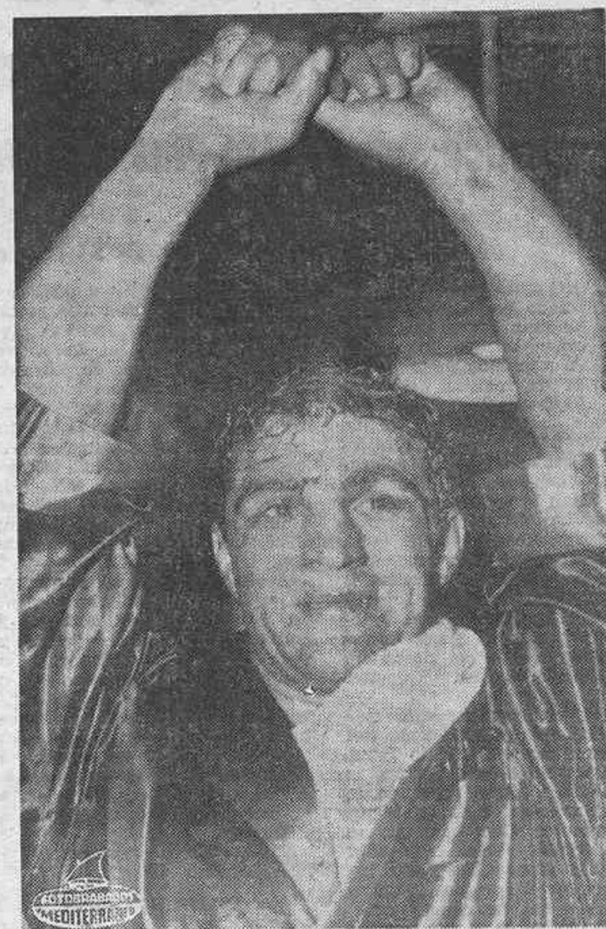
NEWTON (Iowa). — El ex campeón del mundo de todos los pesos Rocky Marciano, que no conoció la derrota, retirándose imbatido del boxeo y siendo campeón del mundo ha encontrado la muerte al estrellarse la avioneta en que viajaba. Debutó en el campo amateur en 1947. Había nacido en Massachusetts. Una actitud muy repetida: vencedor.