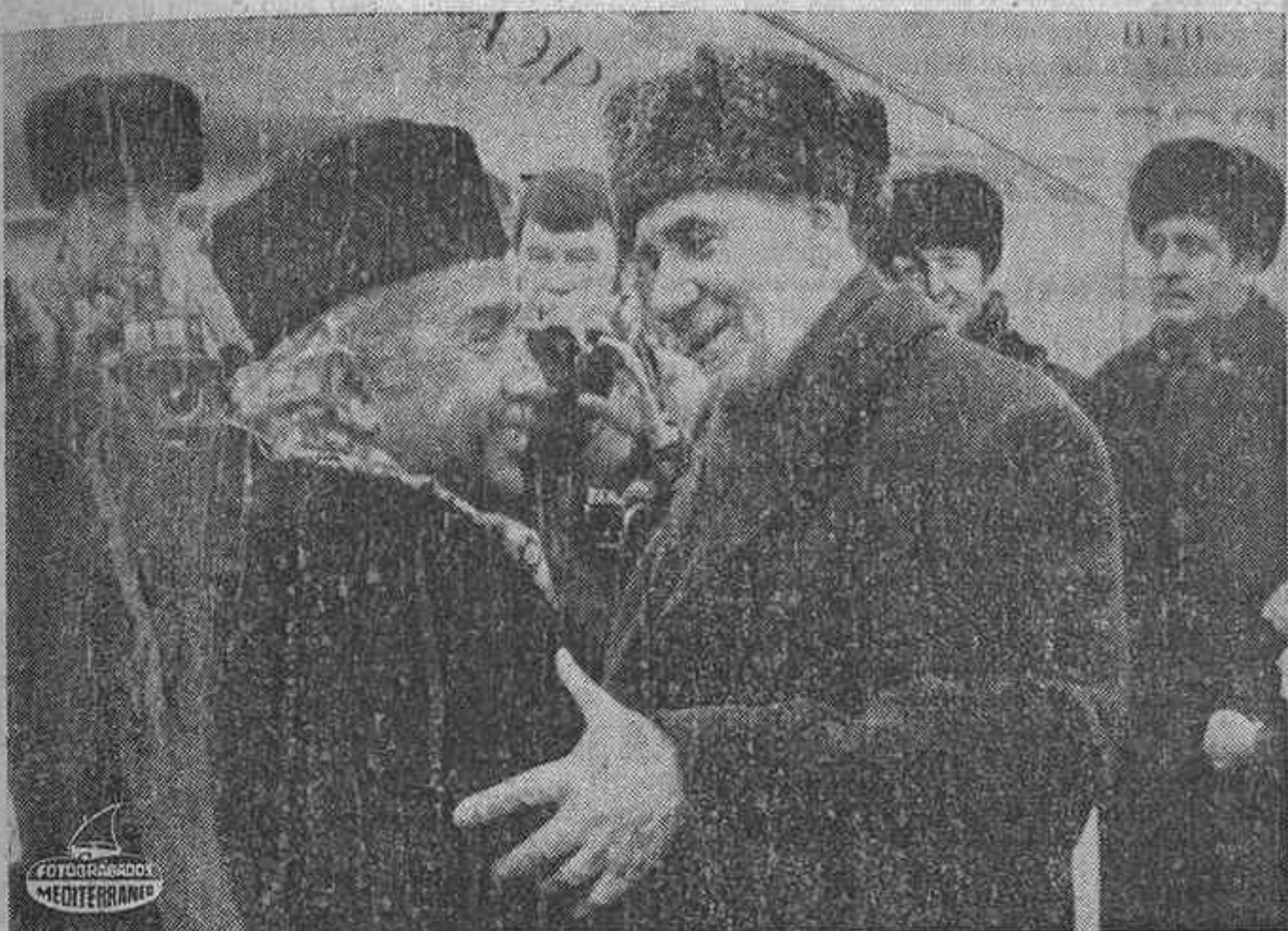
MOSCU. — El ministro soviético de Asuntos Exteriores, Andrei A. Gromyko (a la derecha) recibe al ministro de Asuntos Exteriores de Egipto, Ismail Fahmy, en el aeropuerto de Vnukovo. Los diplomáticos árabes dicen que Fahmy viene a informar a los soviets del acuerdo establecido con Israel para la retirada de fuerzas, y discutir lo concerniente a las futuras conversaciones de paz.

Señala el Ministerio de Hacienda que nuestra moneda se había revaluado en un 19 por ciento frente al conjunto de las de la Comunidad Europea