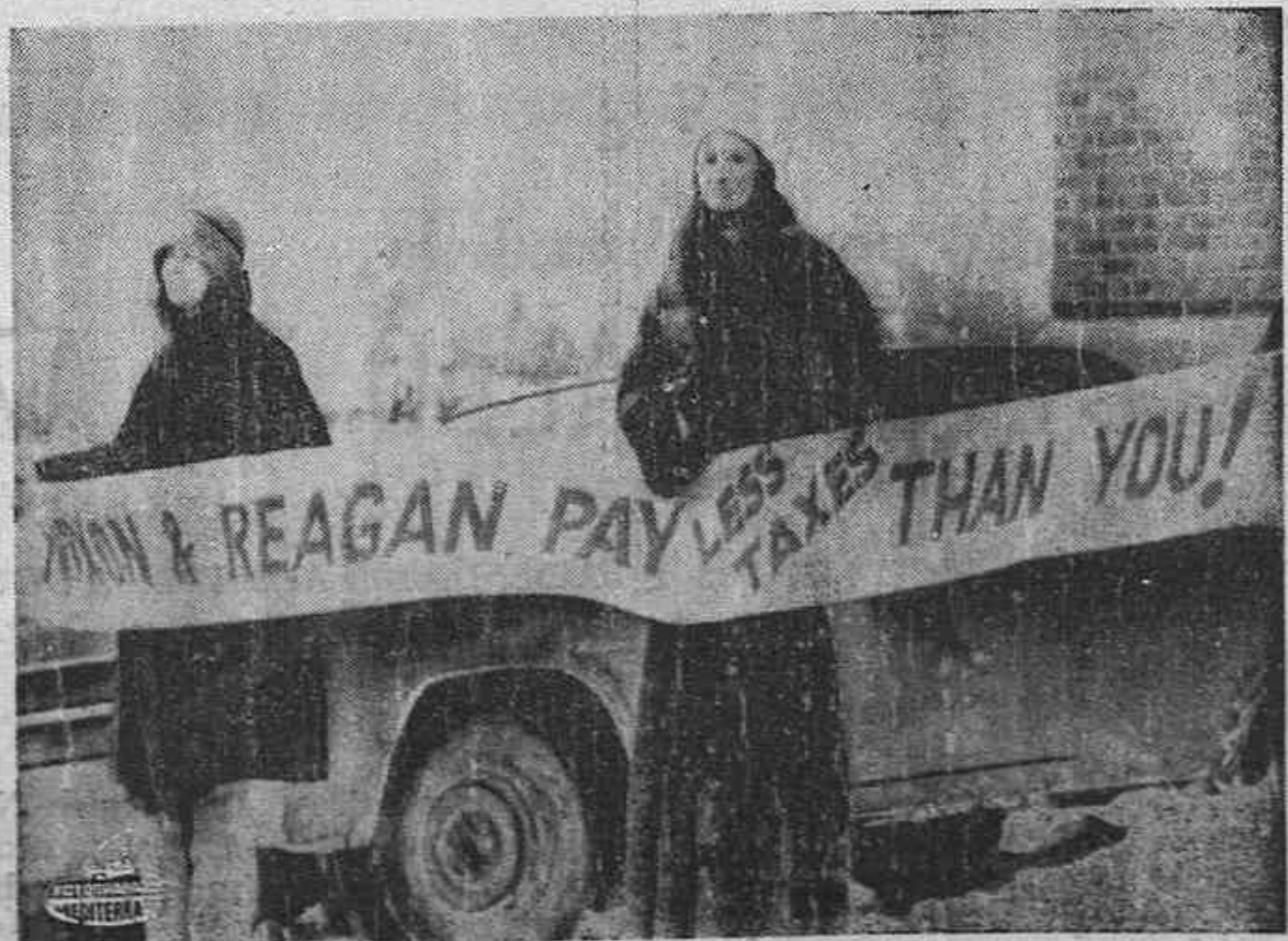
BARRE, Verijoni (EE. UU.). — Unos manifestantes se presentaron ante el Auditorio Municipal, donde el Gobernador de California, Ronald Reagan, pronunciaba un discurso durante una cena en honor de la señora Consuelo Bailey, que perteneció al Comité Nacional del partido republicano. El cartel que portan los manifestantes dice "Nixon y Reagan pagan menos impuestos que usted".