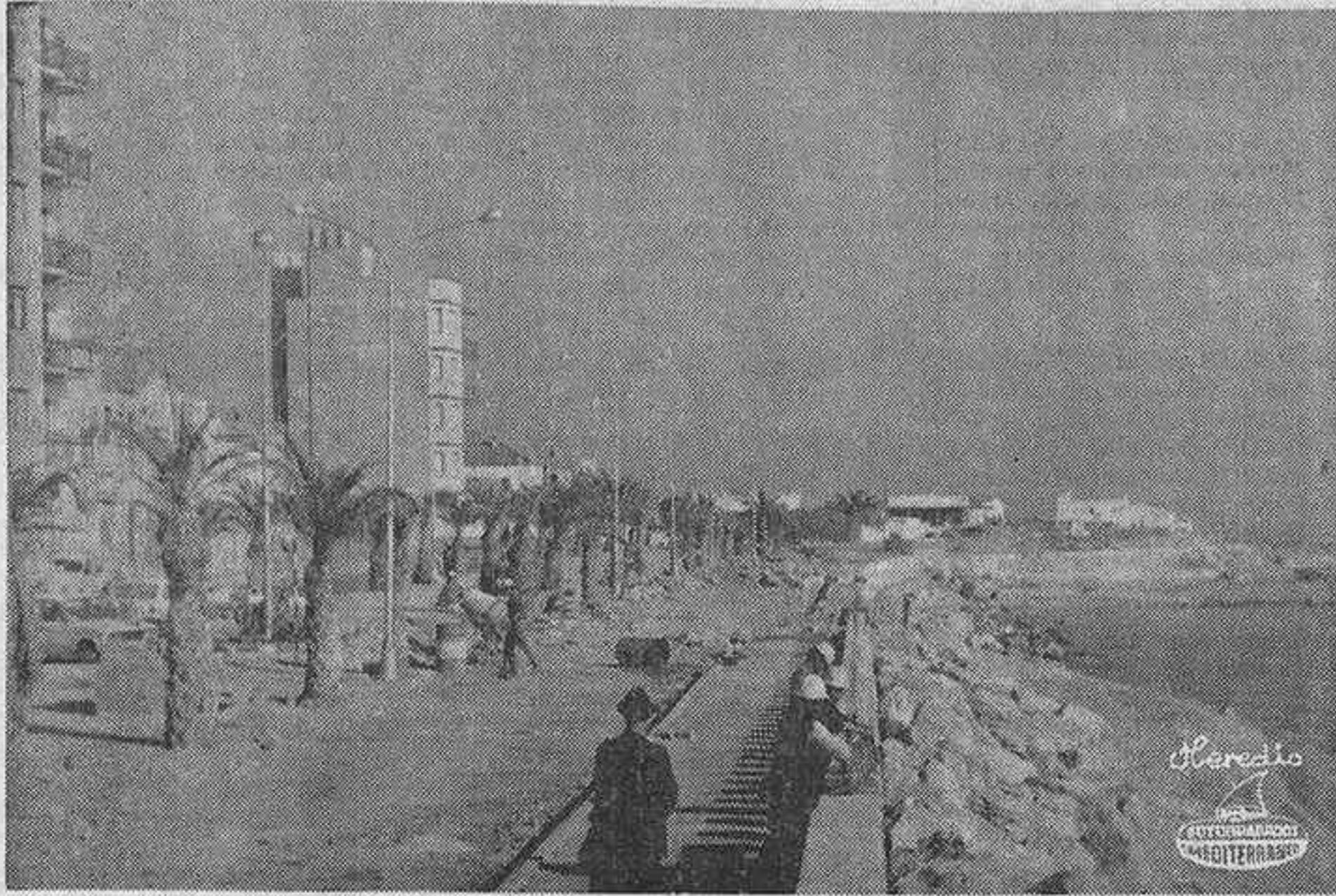
Aspecto de las obras de reconstrucción del muro del Paseo Marítimo, que resultó seriamente afectado por los temporales del invierno anterior.