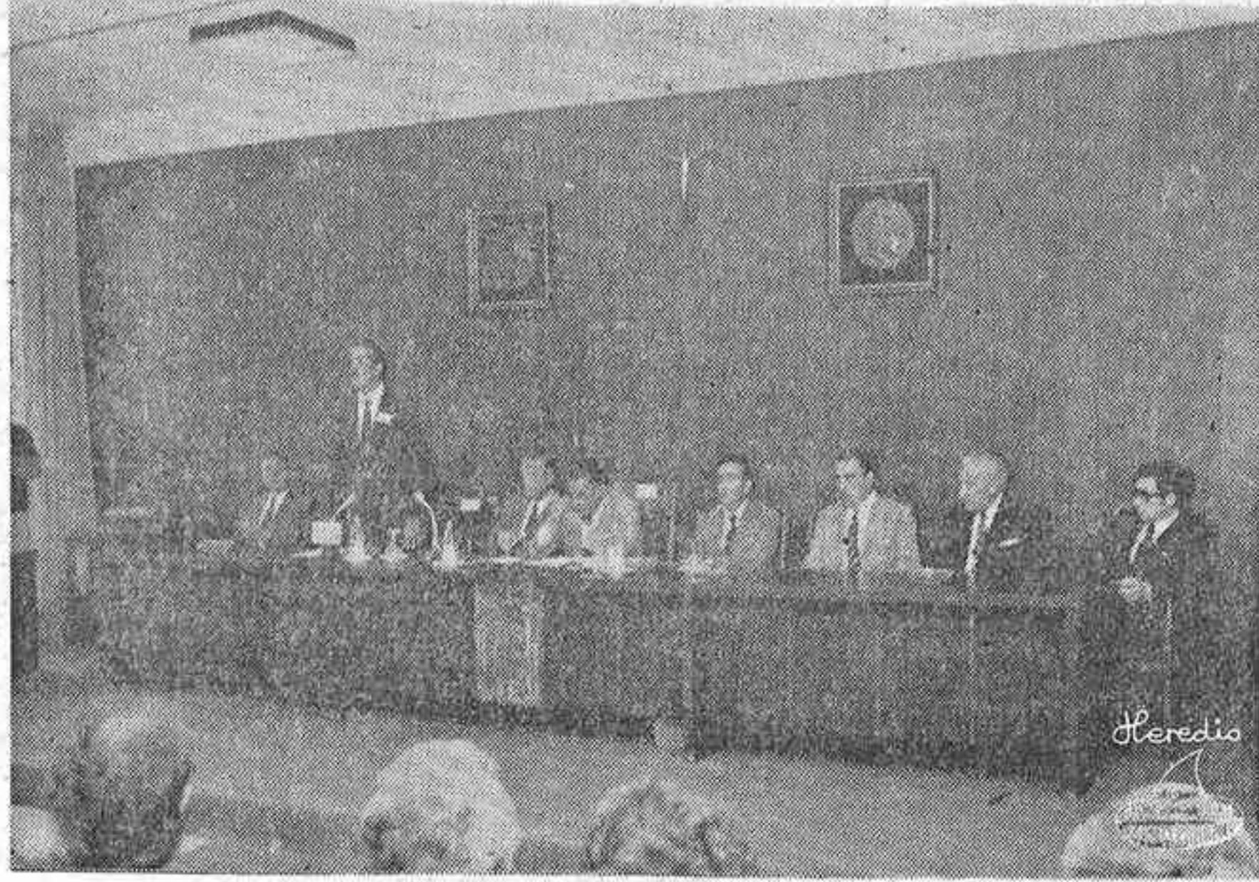
Presidencia del acto de apertura del XV Curso sobre Problemas Políticos de la Vida Local.