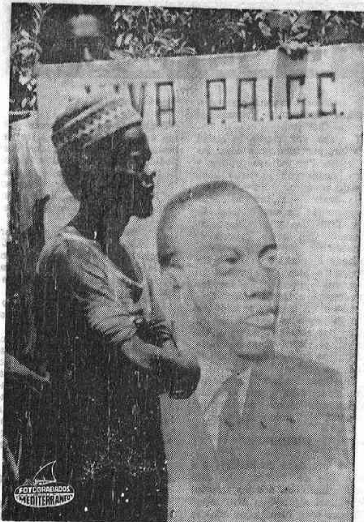
Campanas de agitación política dentro de la legalidad.