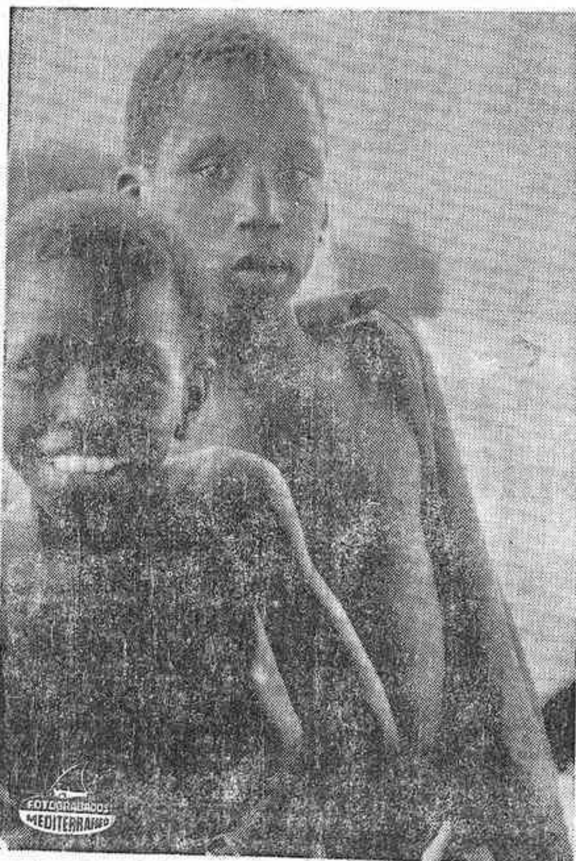
Serán ciudadanos de un país independiente.

único representante legítimo del pueblo de Guinea y Cabo Verde, en las zonas liberadas y en las que no lo son. La caída del castrismo ha abierto un frente de lucha legal que nosotros estamos dispuestos a cubrir. Sin pensar por ello que los otros frentes deban abandonarse. Los muchachos que alguna vez se sonaron guerrilleros pero a quienes la familia, el temor mantuvo en Bissau, los quitacolumnistas del PAIGC entregaron el día 13 de mayo en el Palacio del Gobierno un proyecto de estatutos redactado deprisa, por evitar que la iniciativa de los os-