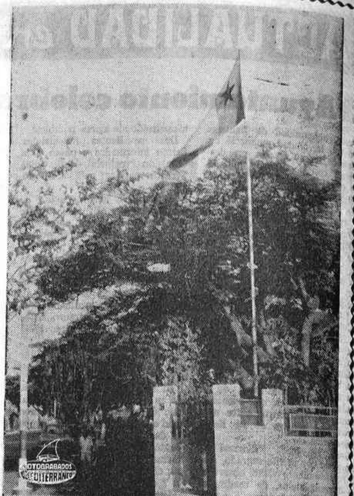
Bandera del PAIGC en el centro de Bissau, en el jardín de la residencia que ocupara un inspector de la PIDE.