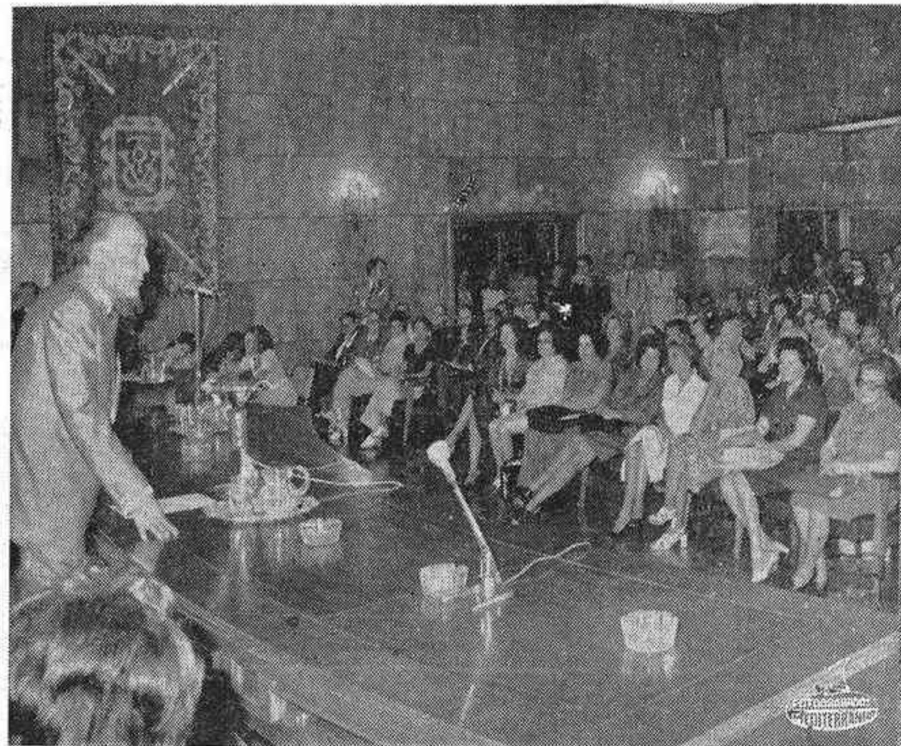
MADRID. — El Vicepresidente tercero y ministro de Trabajo, D. Licinio de la Fuente, durante el anuncio de la concesión de ayudas del Fondo Nacional de Protección al Trabajo en una cuantía superior a los 73 millones de pesetas a 53 guarderías infantiles laborales, durante el acto celebrado en el salón de actos de su Departamento y con asistencia de altos cargos del Ministerio, pleno de la Comisión Nacional de Empleo Femenino y representaciones de las guarderías beneficiadas.

73 MILLONES DE PESETAS PARA AYUDA A GUARDERIAS INFANTILES LABORALES