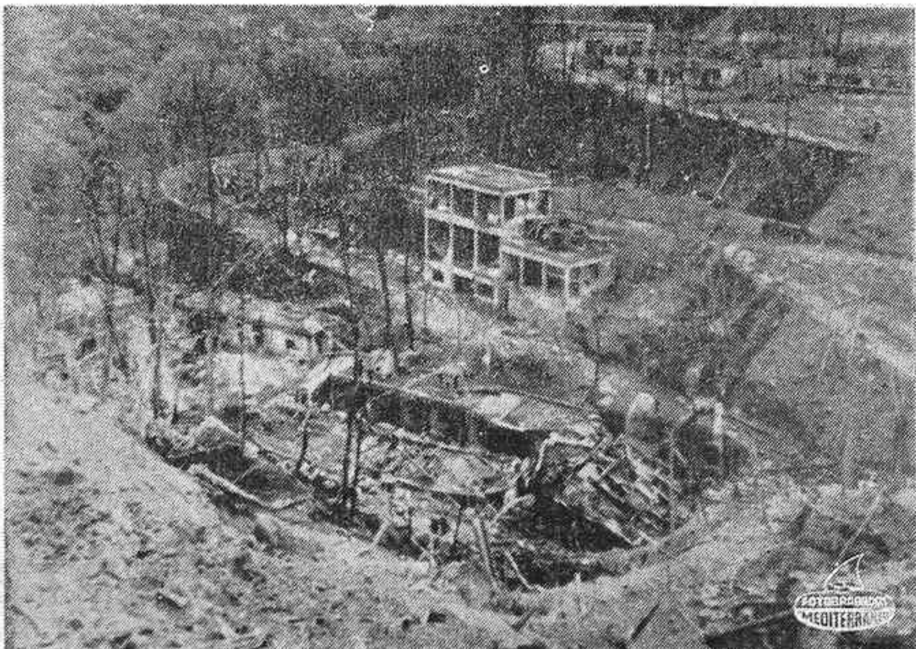
GALDÁCANO. — La violencia de la explosión en la fábrica de la Unión de Explosivos afectó a un área de aproximadamente cinco kilómetros. En la foto, proximidades del pabellón en que ocurrió el siniestro, en el que han perecido 19 personas. — (Foto Cifra Gráfica)