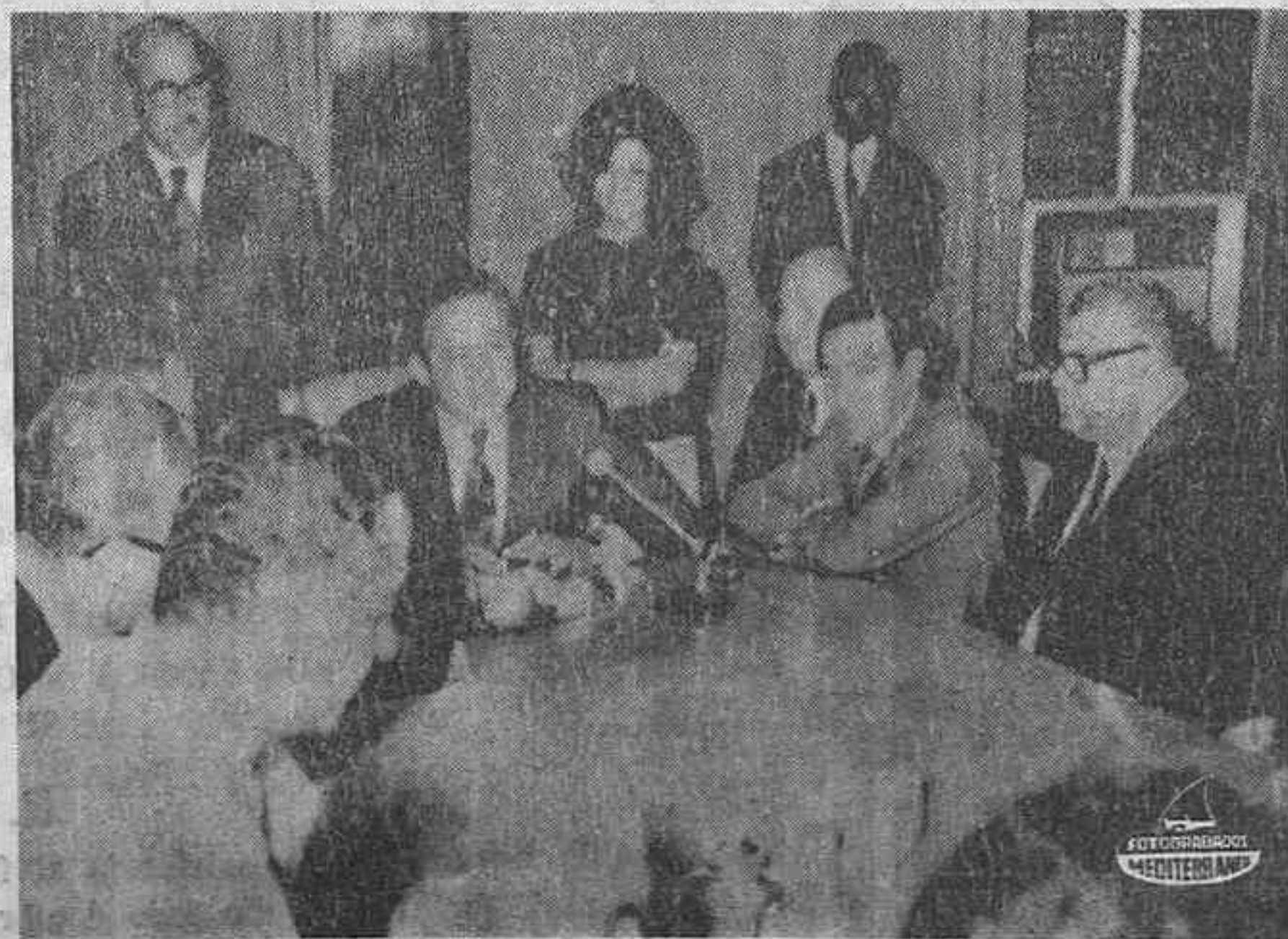
EL CAIRO. — El ministro de Combustibles, Ahmed Mijal, durante la conferencia de Prensa, en la que anunció que una firma norteamericana de construcciones, la Buchtel, de San Francisco, será la que tienda el oleoducto entre Suez y Alejandría, que para 1976 podrá llevar anualmente 40 millones de toneladas de crudos.