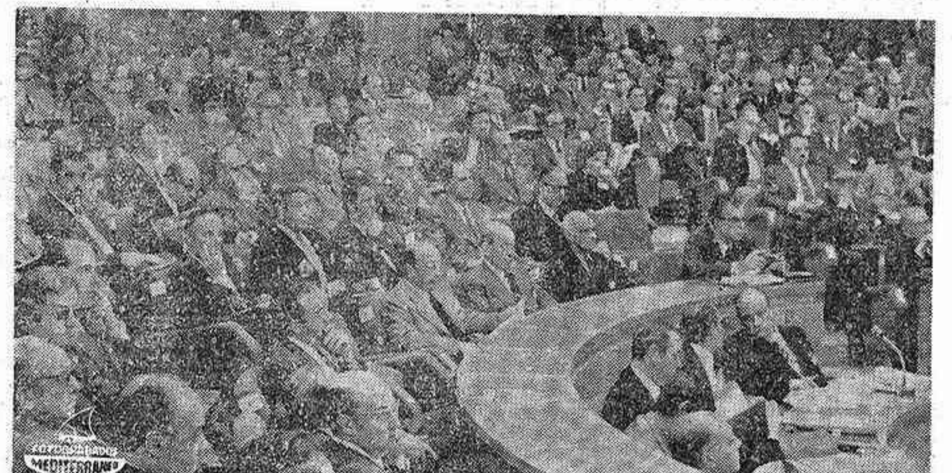
MADRID.—El Ministro de Relaciones Sindicales, Sr. García Ramal, acompañado de los Presidentes de los Consejos Nacionales de Trabajadores y Técnicos y del Consejo Nacional de Empresarios y de otras personalidades, ha presidido el acto inaugural del V Congreso Sindical, integrado por 600 miembros. En las fotos, el Sr. García Ramal durante su discurso en dicho acto y un aspecto de la sala.