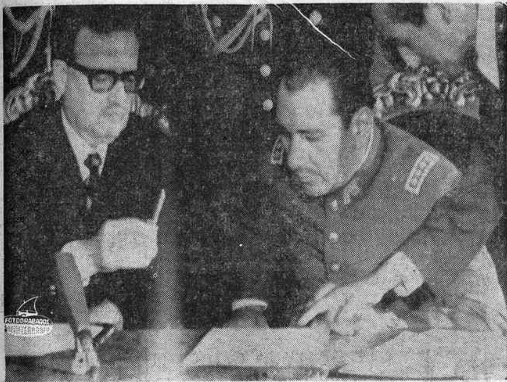
SANTIAGO (Chile). — El Presidente de Chile, Salvador Allende, ofrece la pluma al General Carlos Prats (derecha), su Ministro del Interior, para que firme el decreto en virtud del cual se le nombra Vicepresidente. Prats, nombrado para ocupar su cargo en el gobierno hace tres semanas, será el Presidente en funciones de Chile durante la gira de dos semanas de Allende por el extranjero.

Inversión de 250 millones de dólares para fabricar 250.000 vehículos y crear 8.000 puestos de trabajo