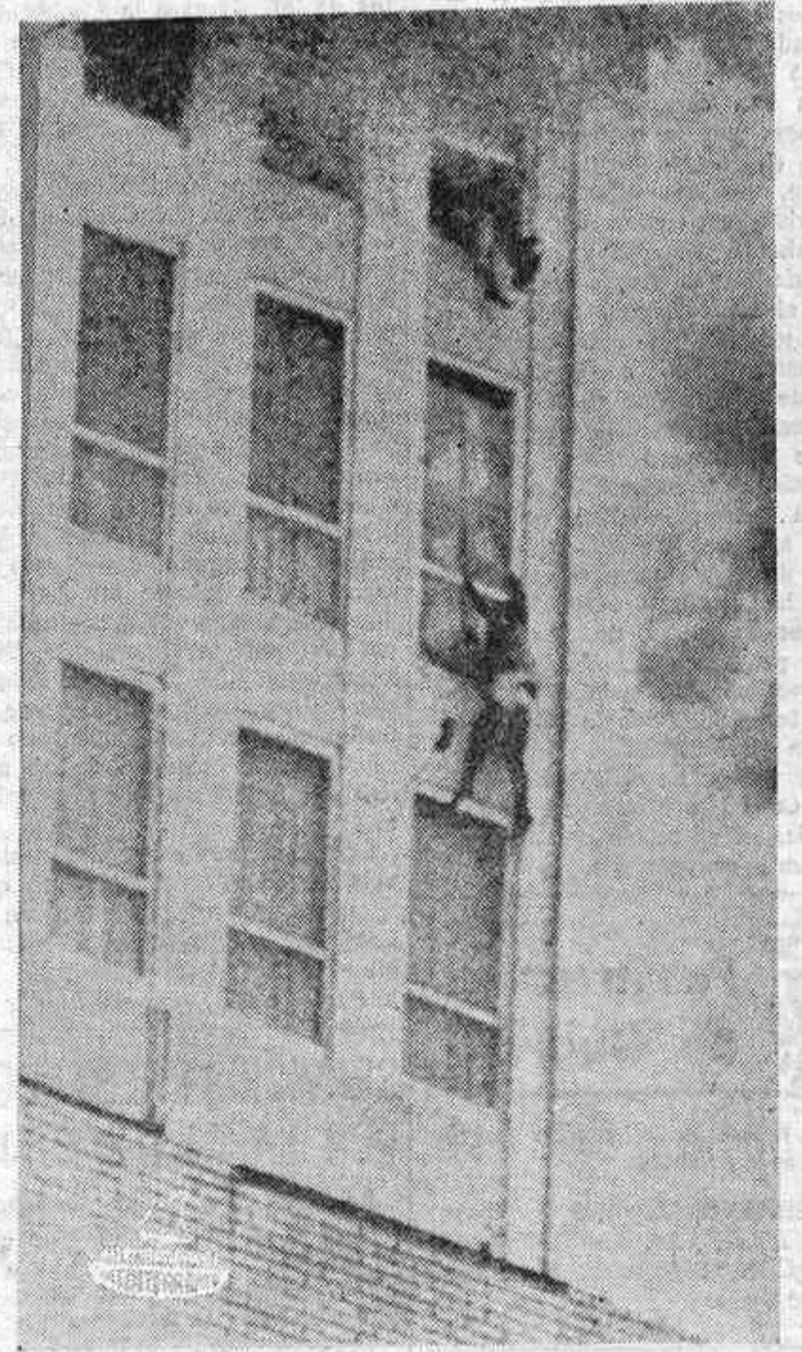
NUEVA ORLEANS. — Una mujer deja de aferrarse y cae desde la ventana de un quinceavo piso del Centro Rault, en tanto que una gran humareda sale de la ventana. Otras personas se disponen a seguirla. Según las informaciones, seis personas resultaron muertas al arrojarse desde las ventanas del edificio hacia un aparcamiento adyacente situado siete pisos más abajo.