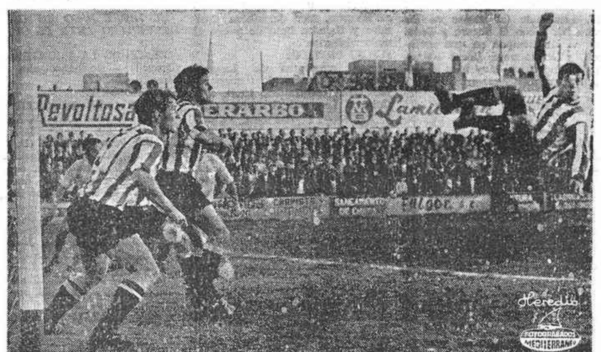
El Logroñés, no obstante su teórica superioridad, puso en el área y ante la puerta tantos jugadores como fueron precisos cuando el Villarreal atacaba