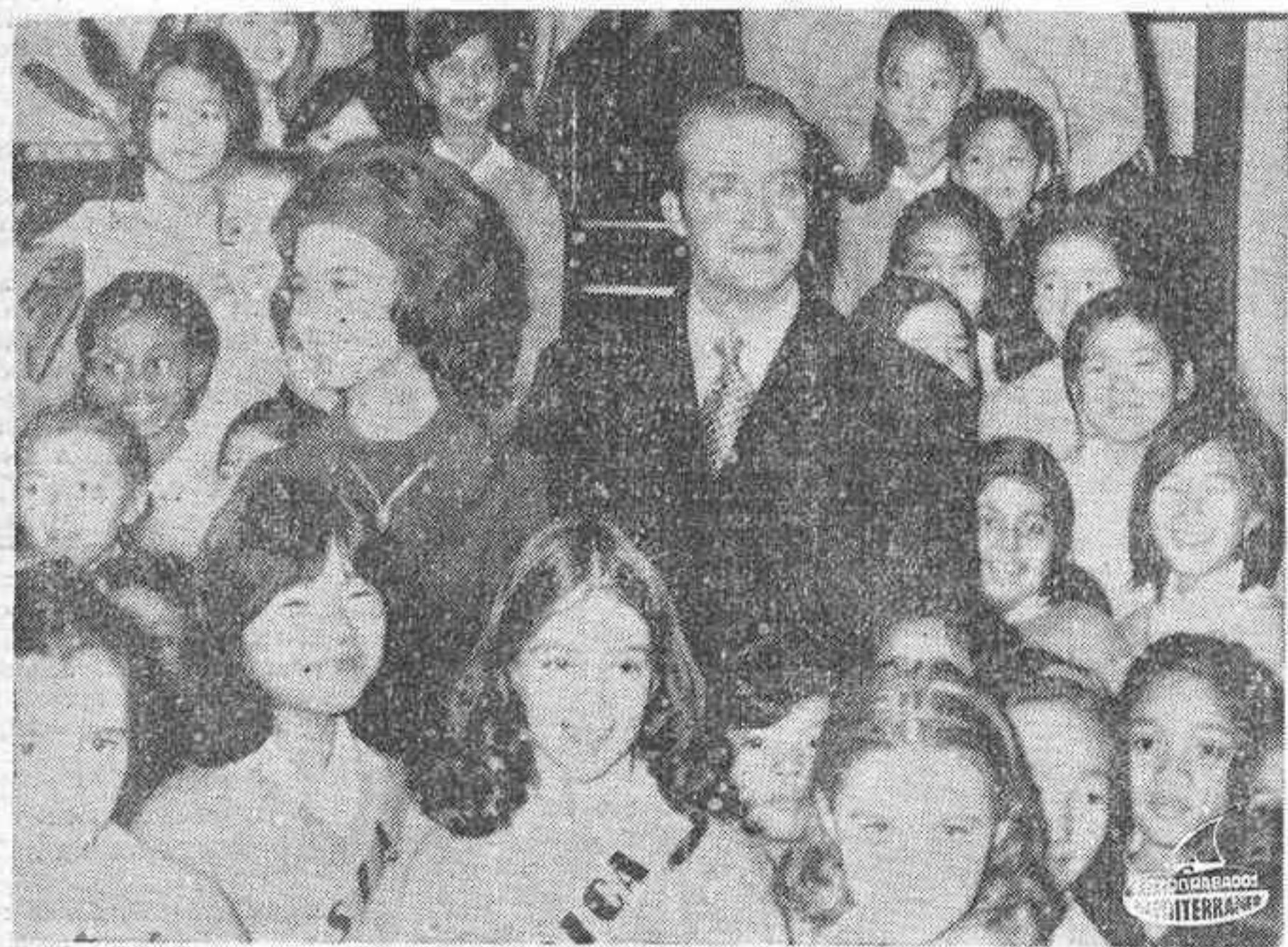
TOKIO. — Los Príncipes de España, D. Juan Carlos y doña Sofía visitaron el Colegio Internacional Selsen. En la foto aparecen rodeados de las colegialas. A este colegio asisten estudiantes de todos los continentes.