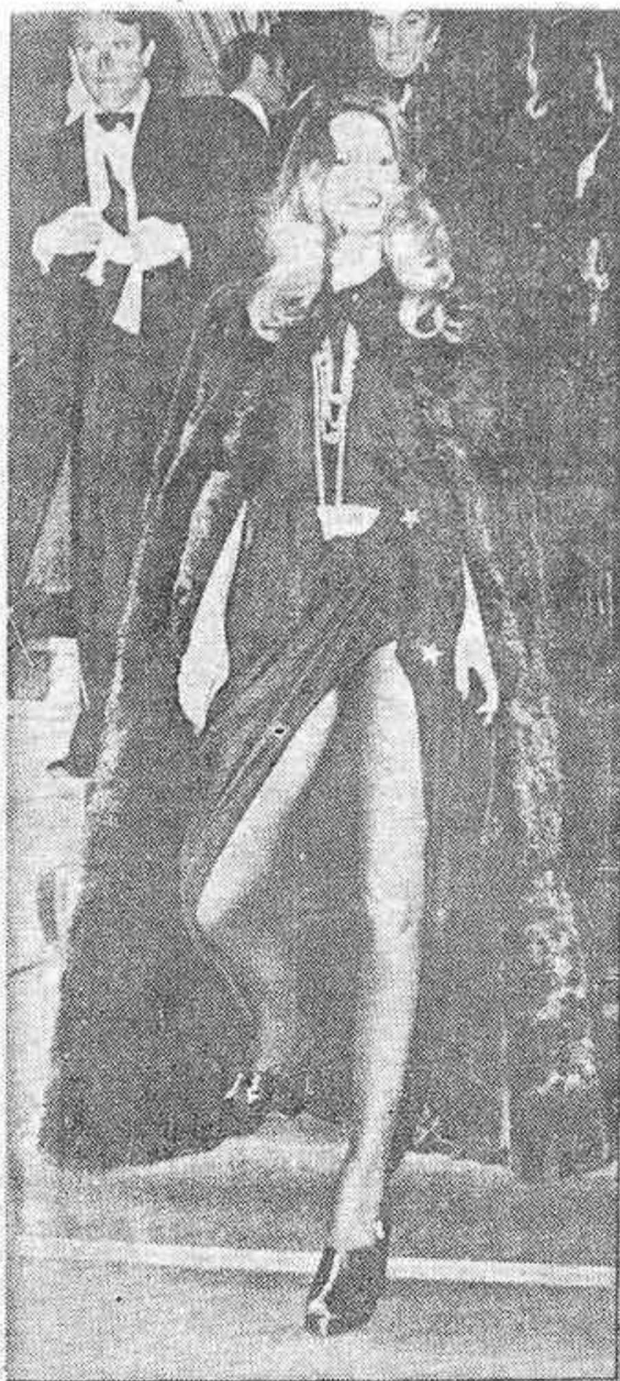
PARIS. — Brigitte Bardot, como una diva de los años treinta, entra en el Lido, con motivo de una fiesta del todo París. B. B. llamó, como siempre, poderosamente la atención por la audacia de su vestido «camp»