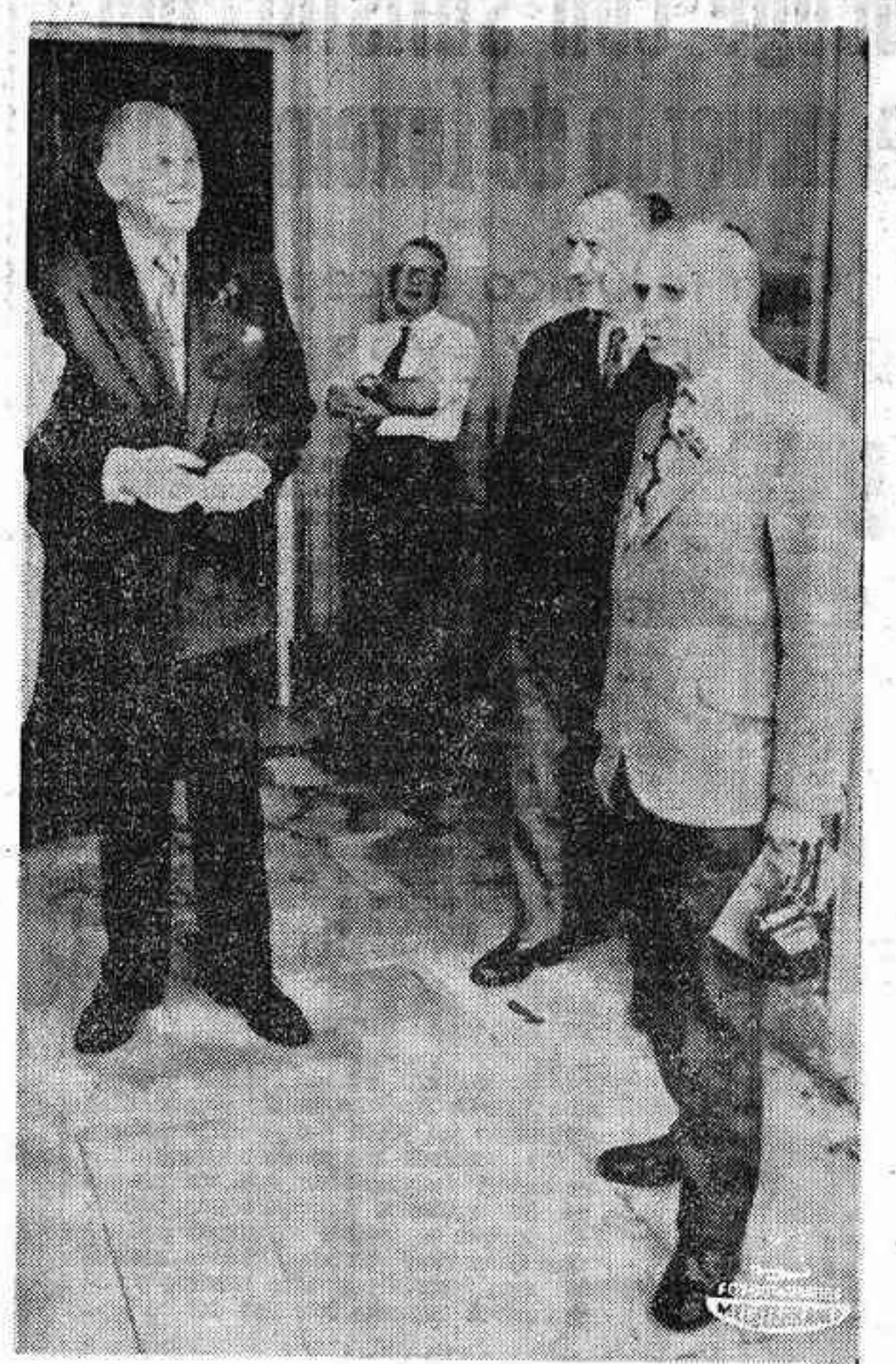
LONDRES. — El jefe del Alto Estado Mayor del Ejército Español, teniente general Manuel Díaz Alegria fotografiado a la entrada del Centro de "Wilton Park" donde esta noche ha pronunciado una conferencia sobre el tema "el problema de la seguridad europea a los 25 años de la Segunda Guerra Mundial"...