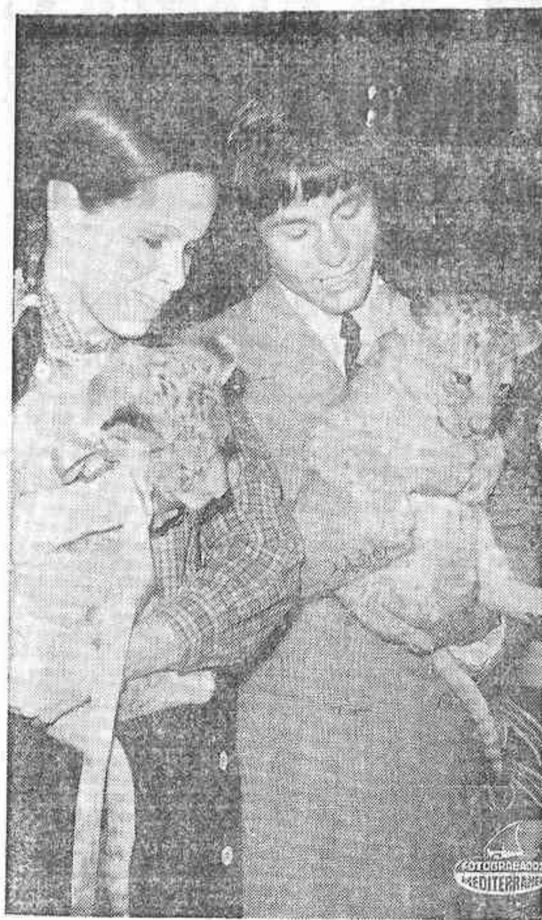
MADRID. — En el Circo Price ha tenido lugar una simpática ceremonia: El bautizo de dos tigres, nacidos hace pocos días en dicho circo...